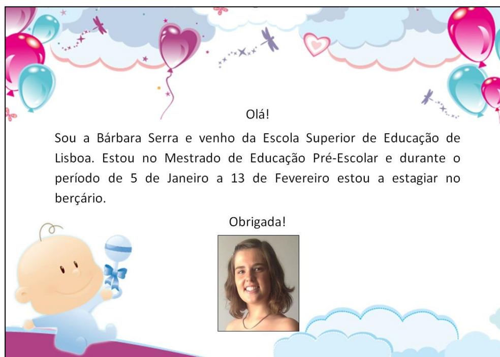
Figura L1. Papel afixado na porta do berçário para a apresentação da estagiária.