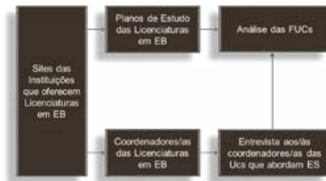
Fig. 1. Design do Estudo

Além disso, assinalaram-se, através da sua denominação, UCs que, embora não incluíssem os termos “sexual”, “sexualidade” ou “saúde”, tivessem potencial para abordar pelo menos um tema de ES, como por exemplo “Psicologia do Desenvolvimento” e “Biologia Humana”.