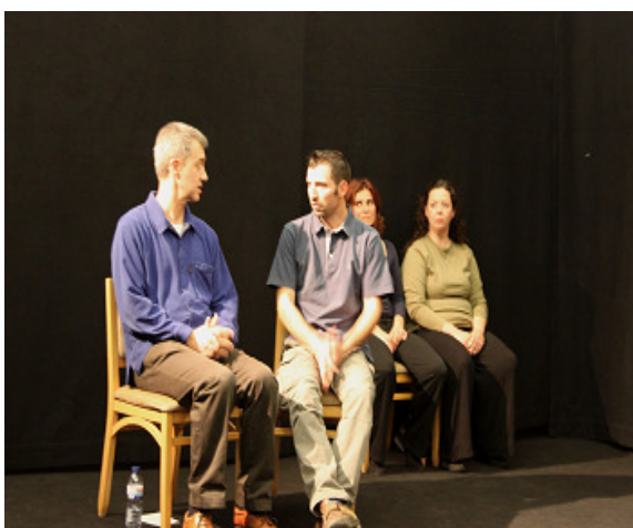
Figura 5 – Encontro de Teatro: História longa