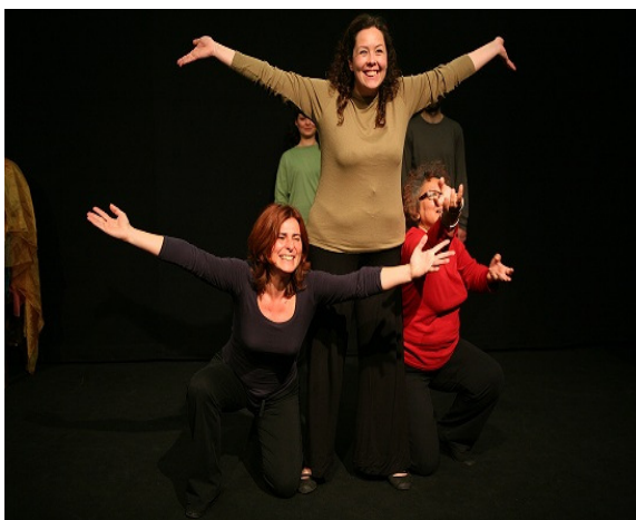
Figura 1 – Encontro de Teatro: Escultura fluída