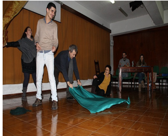
Figura 8 – Ensaios I