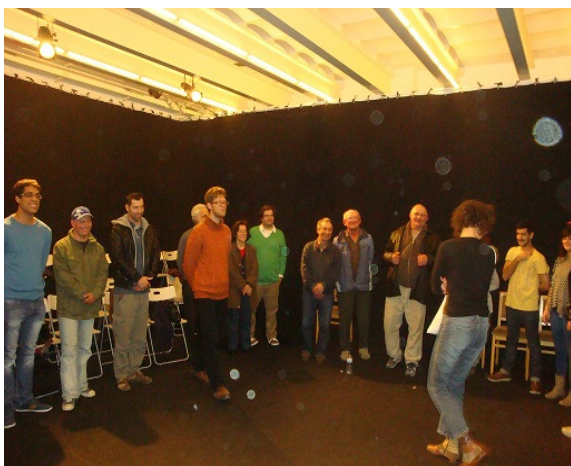
Figura 3 – Encontro de Teatro: Exercícios de sociometria