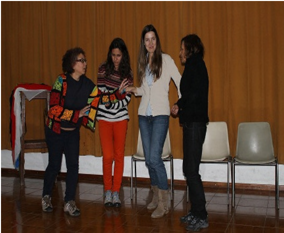
Figura 7 – Ensaios