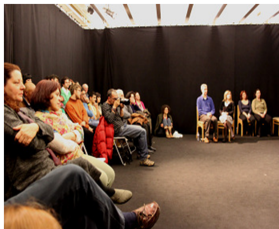
Figura 4 – Encontro de Teatro: Vista geral