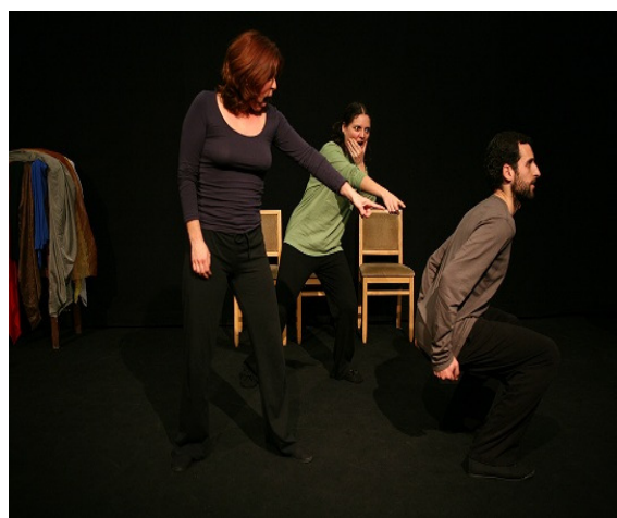
Figura 6 – Encontro de Teatro: Imagem congelada I