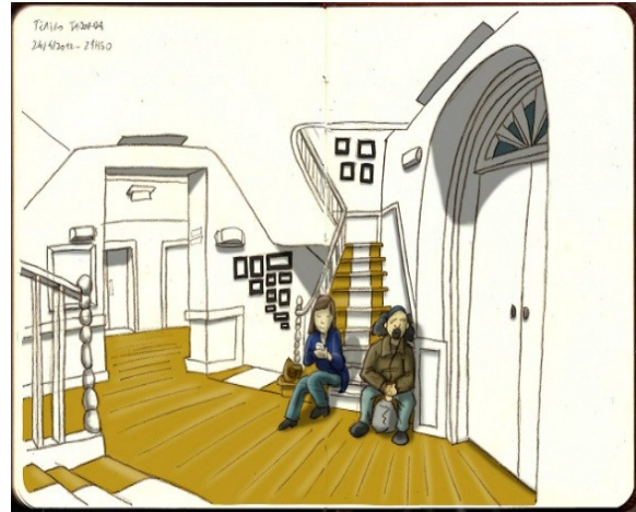
Figura 10 – Encontro de Teatro: Aguardando... por Tiago Leal