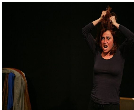
Figura 2 – Encontro de Teatro: Imagem congelada