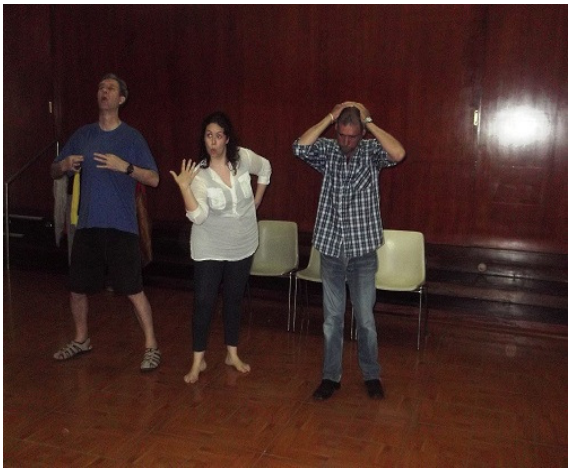
Figura 9 – Ensaios II