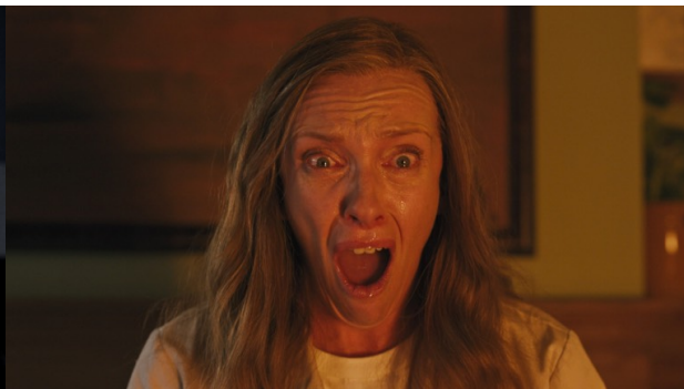
Fig. 3 — Toni Colette em Hereditary (Aster 2018).

Babadook , o antagonista central do filme é, certamente, a sua figura titular. A nível extradiegético, ele é o mais perto que o filme tem de um “vilão”. No entanto, é também importante notar que, a nível diegético, só a personagem de Amelia é que parece enfrentá-lo. Para todas as outras personagens do filme, o “terror” é a figura da mãe instável, com dificuldades em cuidar do seu filho e cuidar de si mesma, algo que preocupa e até repugna aqueles que a observam.