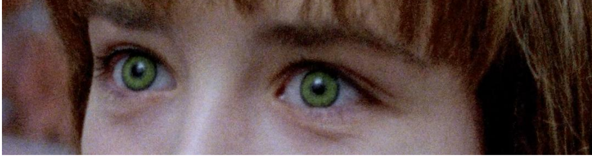
Fig. 4 - Olhos verdes de Helen (Isabelle Adjani).

previamente oculta. A surpresa é de alguém horrorizado, não porque não compreende o terror que vê à frente, mas porque reconhece de onde ele vem.