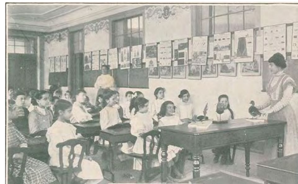
Fig. 8 - Edifício do Calvário: «A aula infantil onde praticam as futuras professoras» na escola anexa

à Escola Normal feminina devia ter aposentos de habitação (para professoras, alunas e serventes), salas de aula, gabinetes, salas de estudo, enfermaria para as educandas e “oficinas indispensáveis para a economia interior da escola”. Aquela instituição devia contar ainda com “uma livraria aonde se achem coligadas as melhores obras sobre a educação e sobre o ensino, e sobre a organização, economia e direção das escolas primárias”, “uma coleção de mapas geográficos”, “uma coleção de instrumentos indispensáveis ao ensino do desenho linear”, “todos os utensílios necessários para a execução dos trabalhos próprios do sexo feminino”, “um terreno para recreação das educandas” e “uma escola primária anexa para os exercícios práticos do ensino”. Algumas fotografias do ano de implantação da República, publicadas na Ilustração Portuguesa , mostram como esse espaço foi ocupado pelos atores, para além de testemunharem algumas das atividades aí desenvolvidas (Fig. 8 e 9).