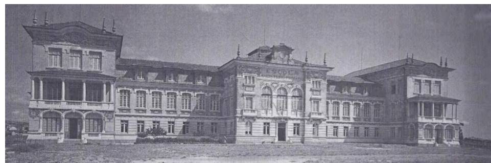
Fig. 5 - Escola Normal/Magistério Primário de Lisboa

concluídas as obras. A monumentalidade do edifício coloca-o ao nível de um verdadeiro “palácio da educação”, como pretendiam muitos políticos e intelectuais que consideravam a educação o elemento mais decisivo para o progresso do país. Essa monumentalidade contribuirá para se considerar a nova Escola Normal como a “Sorbonne de Benfica”, expressão que, como refere Moreirinhas Pinheiro (1990, p.94), as vozes mais críticas utilizavam para se referir depreciativamente à nova instituição de formação de professores.