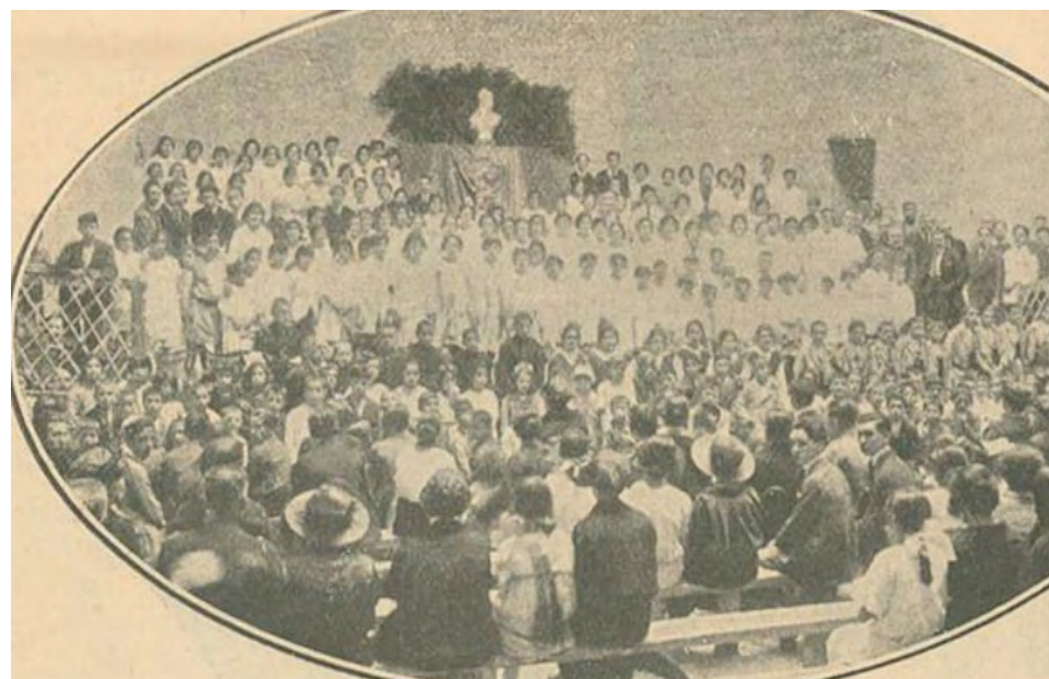
Figura 17- "Matinée de domingo"