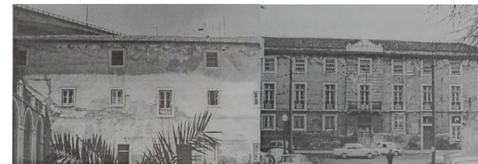
Fig. 1 e 2 – Convento do Calvário. Frontaria e pátio interior

Em Lisboa, a Escola Normal Primária para o sexo masculino passou, em 1914, para as instalações do edifício do Calvário (Figs. 1 a 4), que acolhia a Escola Normal feminina de Lisboa desde 1866, no âmbito do processo de fusão das duas escolas e da concretização do regime de coeducação preconizado pelos republicanos. Este regime, a par da defesa da escola laica, foi uma das referências fundamentais da construção retórica da educação desenvolvida durante este período.