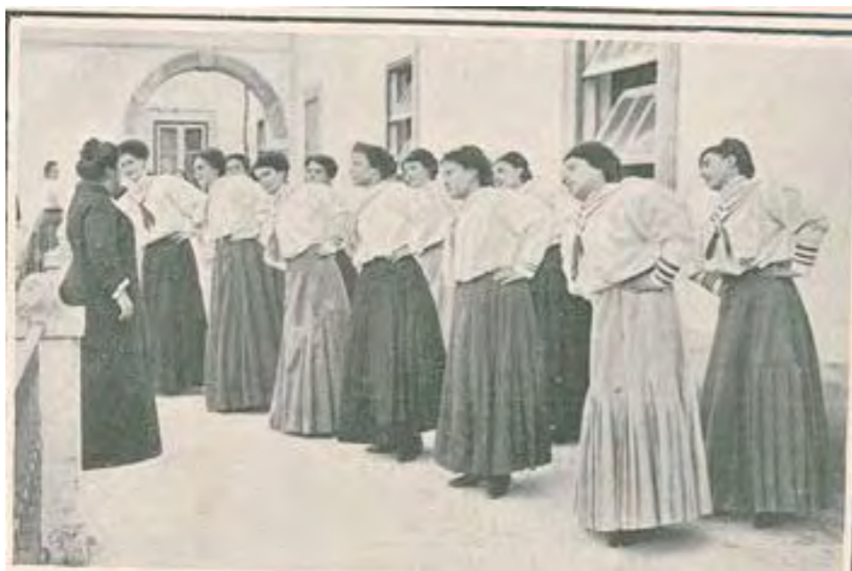
Fig. 10 - Aula de ginástica na Escola Normal para o sexo feminino do Calvário

e científico como os museus, os laboratórios, os gabinetes de experimentação e as oficinas. Por outro, as práticas desenvolvidas ao nível da educação física (fig. 10) são, não só um exemplo desse ideal, mas, também, de alguma maneira, uma representação simbólica da vontade de transformar simultaneamente o corpo e a alma das futuras educadoras do povo, que criariam o homem novo, o novo cidadão, como sublinhámos desde o início.