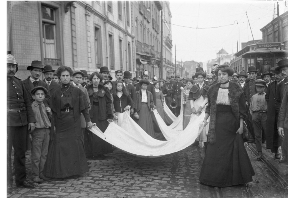
Fig. 11- Bando precatório promovido pelas alunas da Escola Normal de Lisboa a favor das vítimas da Revolução Republicana (1910)

Como já referimos, o crescimento exponencial da formação de professores para o magistério primário, no período da vigência da reforma que vigorou de 1903 a 1918, traduziu-se em 12.493 inscritos no primeiro ano, 3930 dos quais nas escolas normais de Lisboa Porto e Coimbra. Destes diplomaram-se 9228, mas apenas 2723 nas escolas normais propriamente ditas de Lisboa, Porto e Coimbra. A título de exemplo, refira-se que no ano letivo de 1916-1917 a escola mista de Lisboa tinha