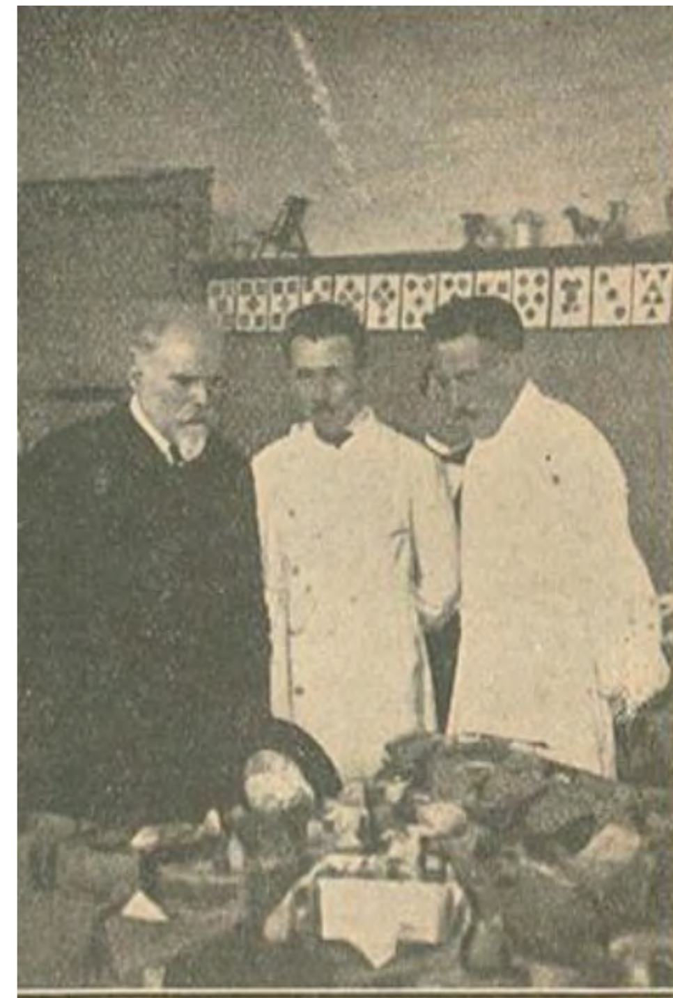
Fig. 16 - O Chefe de Estado visitando a exposição de trabalhos escolares