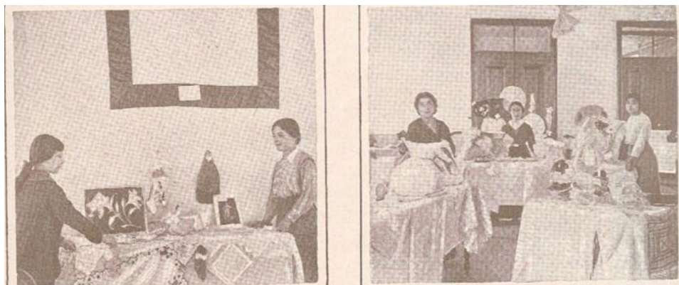
Fig. 14 e 15- Exposição de trabalhos das alunas da Escola Normal do sexo feminino que encerrou no último dia de julho de 1914