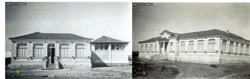
Fig. 6 e 7 - Fachada principal e lateral direita da escola de aplicação

à Escola Normal feminina devia ter aposentos de habitação (para professoras, alunas e serventes), salas de aula, gabinetes, salas de estudo, enfermaria para as educandas e “oficinas indispensáveis para a economia interior da escola”. Aquela instituição devia contar ainda com “uma livraria aonde se achem coligadas as melhores obras sobre a educação e sobre o ensino, e sobre a organização, economia e direção das escolas primárias”, “uma coleção de mapas geográficos”, “uma coleção de instrumentos indispensáveis ao ensino do desenho linear”, “todos os utensílios necessários para a execução dos trabalhos próprios do sexo feminino”, “um terreno para recreação das educandas” e “uma escola primária anexa para os exercícios práticos do ensino”. Algumas fotografias do ano de implantação da República, publicadas na Ilustração Portuguesa , mostram como esse espaço foi ocupado pelos atores, para além de testemunharem algumas das atividades aí desenvolvidas (Fig. 8 e 9).