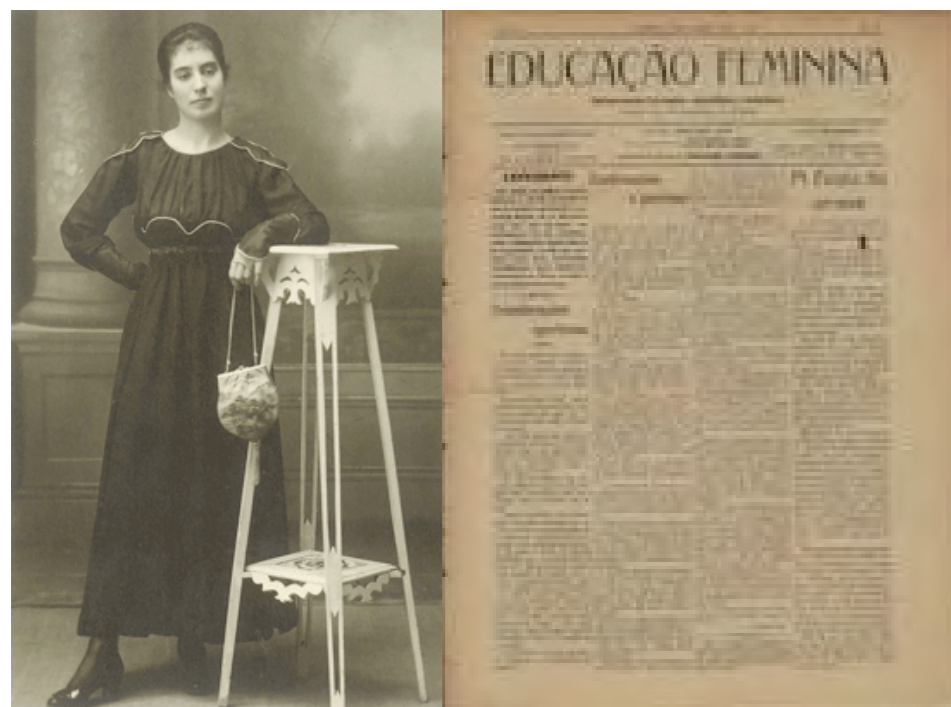
Fig. 12- Irene Lisboa em 1917 e Fig. 13 – Primeira página de Educação Feminina

No Dicionário de Educadores Portugueses (Nóvoa, 2003), que não sendo exaustivo contempla ainda assim 900 biografias, contamos 33 biografados formados nas escolas normais de Lisboa, isto é, cerca de 3,6% das personalidades tratadas na obra. Destas, 27 são do género masculino formados na escola de Marvila (11), de Santos (15) e de Benfica (1), e as restantes 6 incluídas no dicionário foram alunas-mes-