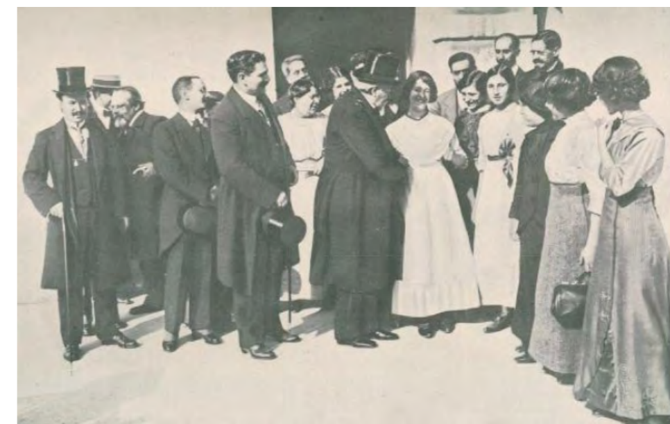
Fig. 13 - Manuel de Arriaga visita a exposição de liores. Atrás de si está o ministro da instrução

Finalmente, destacamos Amália Luazes que foi professora no ensino normal durante o curto mas agitado período de meados de 1910 a meados de 1918, assegurando as disciplinas de Moral e Economia doméstica, Liores e Desenho. Esforçou-se por valorizar a