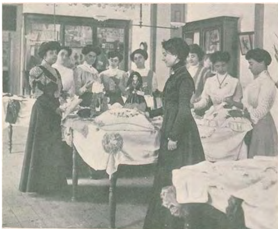
Fig. 9 - Edifício do Calvário: «O museu da escola e a exposição de labores»

e científico como os museus, os laboratórios, os gabinetes de experimentação e as oficinas. Por outro, as práticas desenvolvidas ao nível da educação física (fig. 10) são, não só um exemplo desse ideal, mas, também, de alguma maneira, uma representação simbólica da vontade de transformar simultaneamente o corpo e a alma das futuras educadoras do povo, que criariam o homem novo, o novo cidadão, como sublinhámos desde o início.