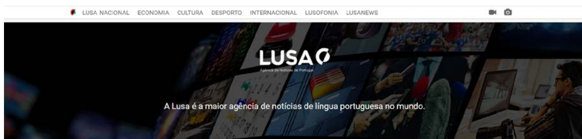
Figura 4 - Reprodução do site www.lusa.pt .

Para efeitos de comparação, a Agência Brasil produziu cerca de 20 mil matérias jornalísticas em 2020 e todo o material pode ser utilizado gratuitamente pela imprensa. O órgão público, que faz parte da Empresa Brasileira de Comunicação (EBC), tem 99 funcionários, sendo que 68 atuam como jornalistas. Os dados foram obtidos diretamente com o governo brasileiro através da Lei de Acesso à Informação (12.527 de 2011).