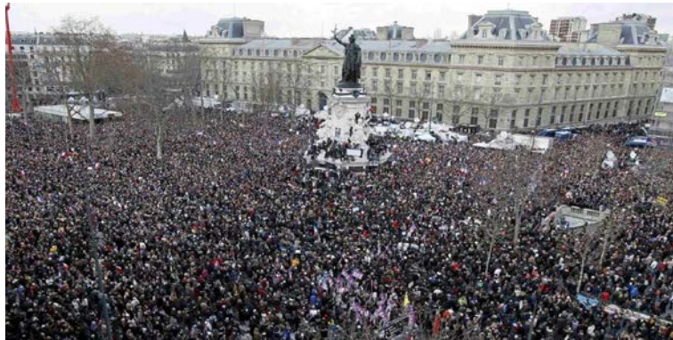
Figura 1 - Milhares de franceses foram às ruas para manifestar contra o terrorismo.

Ao analisar três imagens dessas manifestações em Paris, percebe-se a importância dos enquadramentos para o recorte das notícias.