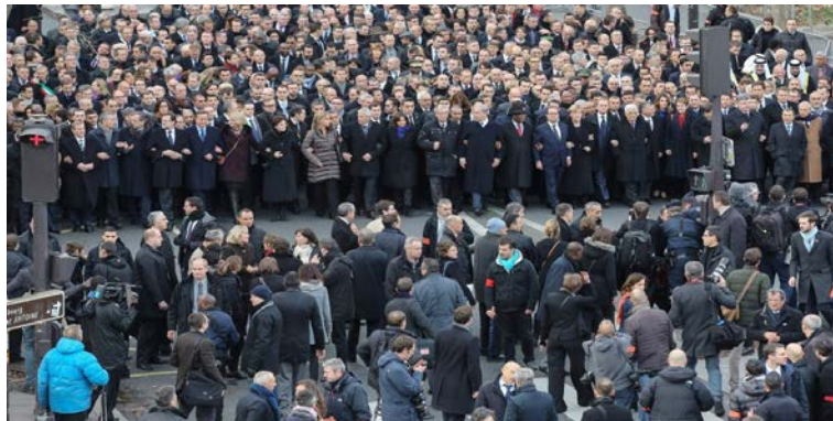
Figura 2 - Líderes políticos participam dos atos e puxam manifestação.