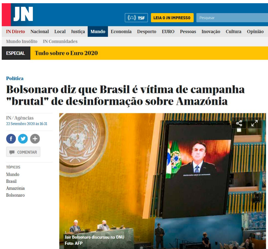
Figura 5 - Texto publicado no JN a 22 de setembro de 2020.

Interessante observar que o JN não deu crédito à Lusa na matéria publicada na internet em 22 de setembro de 2020. A peça foi assinada como “ JN/Agências ”, no plural. No entanto, o texto é praticamente o mesmo que foi feito pela agência de notícias. Foram feitas duas alterações pontuais: o título trouxe a palavra “brutal” entre aspas e o primeiro parágrafo foi trocada a palavra “hoje” por “esta terça-feira”. Além disso, foi corrigido um erro na digitação da palavra “Brasil” no último parágrafo. A Lusa escreveu “Brsil”, sem a letra “A”.