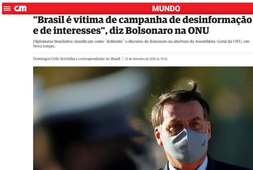
Figura 7 – Texto do Correio da Manhã destacou as questões ambientais.