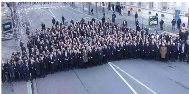
Figura 3 - Na verdade, os políticos estavam a alguns quarteirões de onde estavam a população.