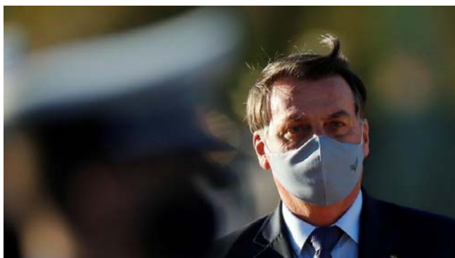
Jair Bolsonaro

Num discurso considerado "delirante" por diplomatas brasileiros e que a imprensa do país avaliou não poder ser levado a sério, o presidente Jair Bolsonaro declarou esta terça-feira na abertura da Assembleia-Geral da ONU, em Nova Iorque, que o Brasil é um exemplo para o mundo na questão ambiental mas que, pelas riquezas das suas florestas, está a ser vítima de uma campanha de desinformação e de interesses escusos, principalmente em relação à Amazónia e ao Pantanal. Devido à pandemia da Covid-19, a sessão deste ano da Assembleia-Geral da ONU foi virtual e o discurso de Bolsonaro foi previamente gravado.