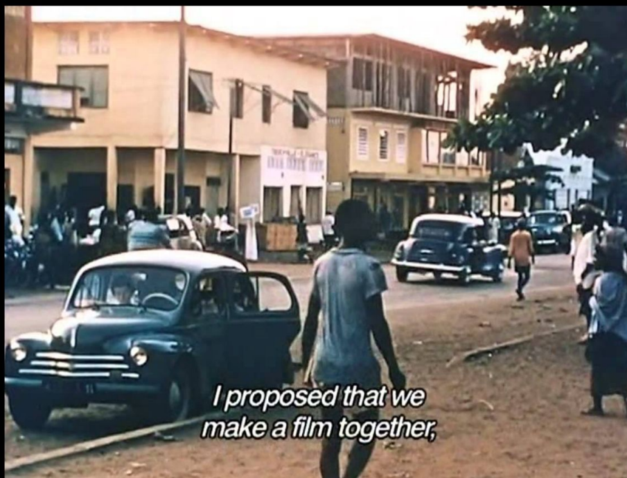
Moi, un noir (Jean Rouch, 1958)

utilizou-se como exemplo o filme Moi, un noir (1958), de Jean Rouch, devido à dinâmica entre o realizador e as personagens, que também não são atores, mas participam ativamente na produção do filme.