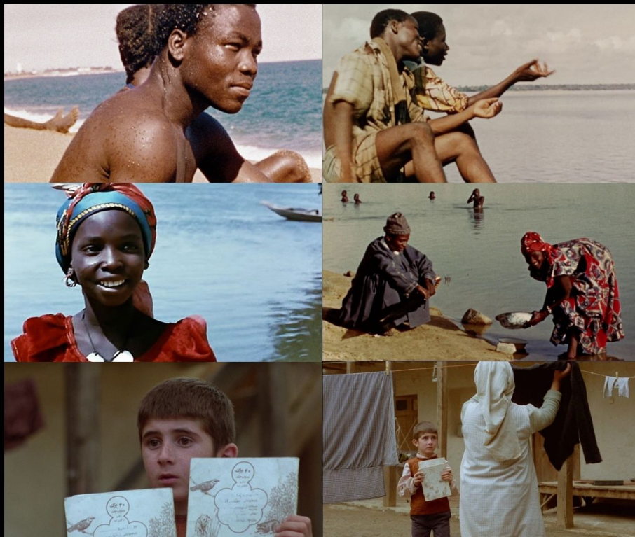
Moi, un noir (Jean Rouch, 1958); Jaguar (Jean Rouch, 1967) Where is the Friend's House? (Abbas Kiarostami, 1987)