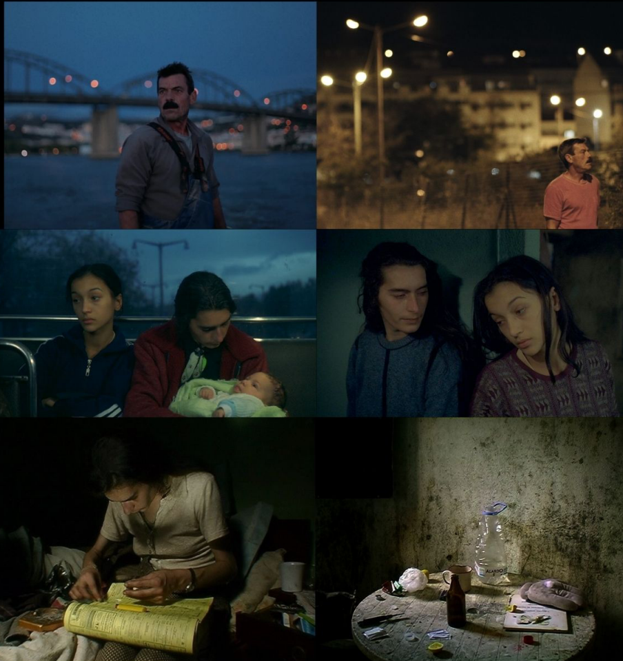
Terra Franca (Leonor Teles, 2018) Ossos (Pedro Costa, 1997); No Quarto da Vanda (Pedro Costa, 2000)