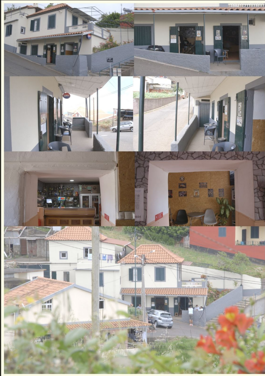
Taberna do Pomar, tasca das filmagens.