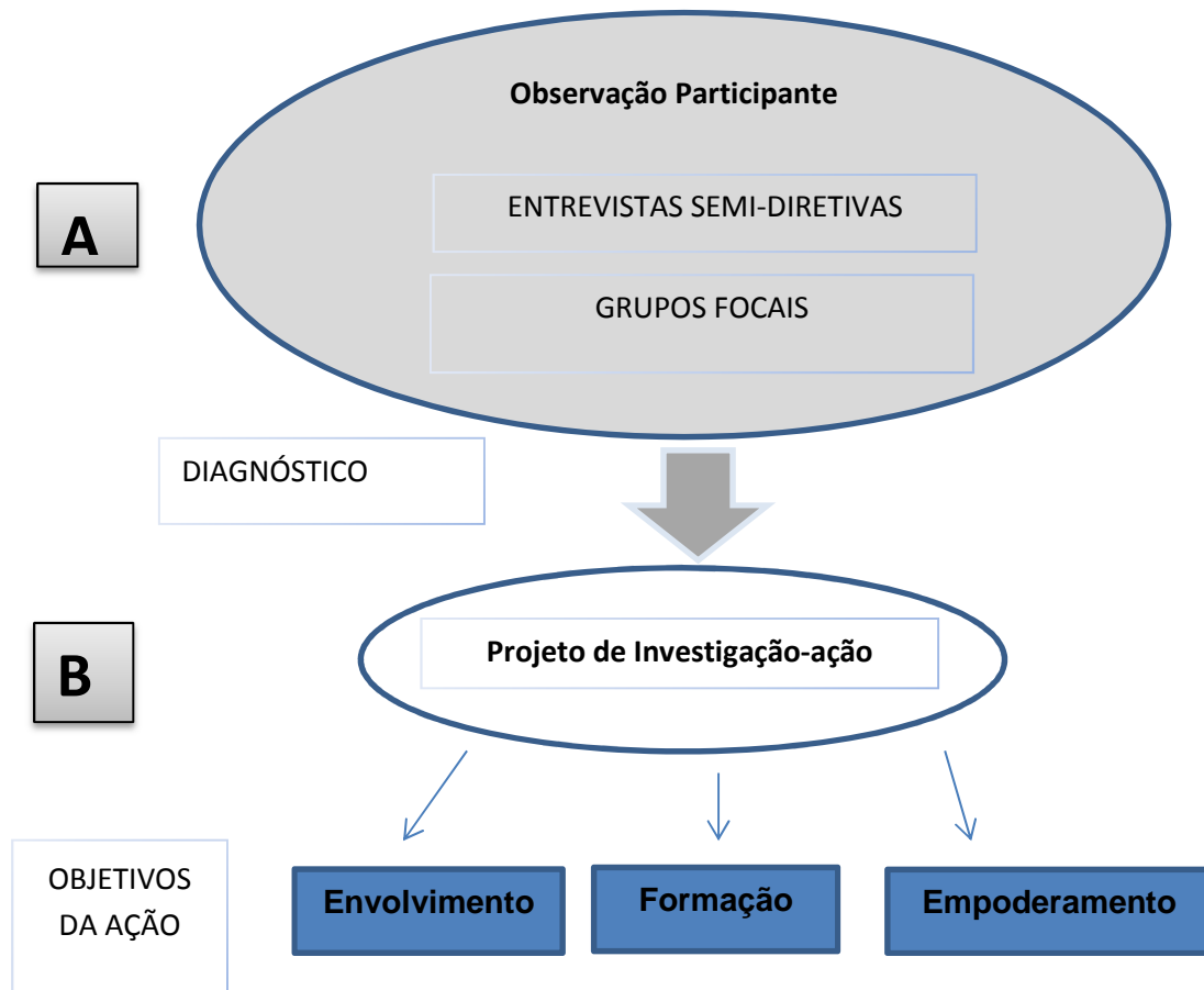
Figura 2 - Desenho da aplicação das técnicas de pesquisa.

análise de conteúdo de correspondem a um “conjunto de técnicas de análise das comunicações, que utiliza procedimentos sistemáticos e objetivos de descrição do conteúdo das mensagens” e permite realizar a “inferência de conhecimentos relativos às condições de produção (ou, eventualmente de receção)” (Bardin, 1977).