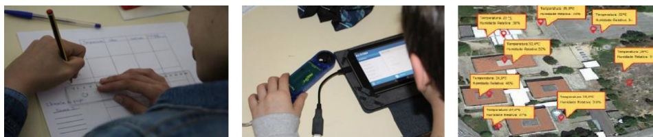
Figura 1. Elaboração de tabela de registo; medição com o anemómetro na sala de aula; Locais de medição escolhidos pelas crianças.

As sessões com as crianças decorreram no final do mês de maio. Na primeira sessão, realizada numa aula de 90 min de Ciências Naturais, as estudantes começaram por explorar com as crianças o conceito de temperatura, humidade e sensação térmica através da apresentação e discussão de várias imagens que representavam paisagens e situações do quotidiano. As crianças participaram ativamente e responderam em diálogo a várias questões como escolher peças de vestuário e tipo de alimentos mais adaptados ao verão e ao inverno, tipo de ambientes que procuramos nestas estações do ano e identificar vários tipos de paisagem como sendo húmida, seca, fria ou quente. Como primeira aproximação à utilização do sensor, as crianças foram convidadas a descrever o ambiente na sala de aula e a medir a temperatura e humidade, tarefa que desenvolveram sem dificuldade. Com o auxílio da projeção da planta da escola, as crianças sinalizaram, em conjunto, os locais que desejavam monitorizar. Após esta tarefa, foram organizados em grupos para construírem as tabelas de registo e efetuarem as medidas. Cada grupo mediu a temperatura e a humidade em pelo menos dois dos locais pré-definidos. Após esta recolha em espaços interiores e exteriores, as crianças partilharam as suas medições, adicionando uma legenda em cada um dos pontos assinalados na planta da escola e completaram a sua folha de registos. A figura 1 representa vários momentos desta atividade.