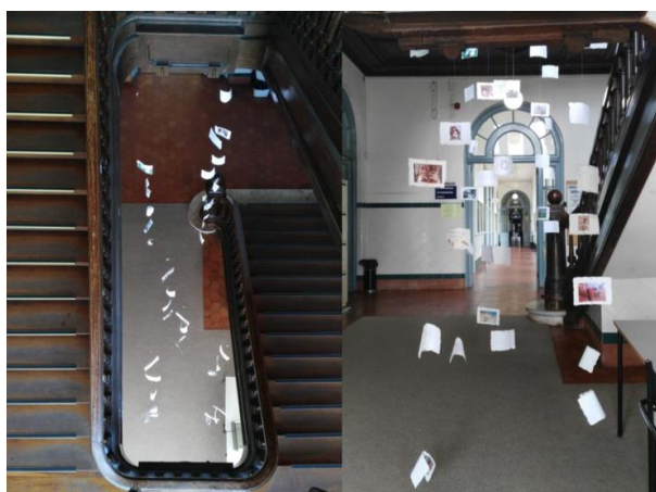
Figura 2 Instalação “REC (Record)”

Estes contributos, recolhidos em folhas de papel previamente preparadas, foram suspensos com fio de nylon a uma estrutura de madeira com o propósito de ficarem “a pairar no ar”, movendo-se de modo a representarem a efemeridade das memórias que nem sempre permanecem intactas (Figura 2). A última fase deste processo de trabalho resultou numa exposição e num diálogo com o público (Figura 3).