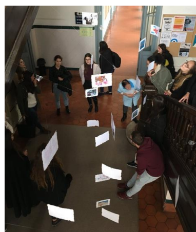
Figura 3 Conversa com o público

O segundo projeto intitulado “Who are you when no one is watching you?”, foi desenvolvido por uma estudante de Erasmus proveniente da Eslovénia que iniciou o semestre em regime presencial na unidade curricular de Artes Plásticas II, no ano letivo de 2019-2020, mas que devido à situação pandémica acabou por concluir e apresentar o projeto no sistema de ensino à distância.