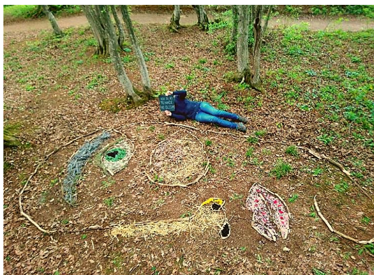
Figura 5 Projeto final “Who are you when no one is watching you?”, fotografia de Lina Drenik.