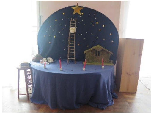
Fig. 6 - Mesa de estação (Natal)