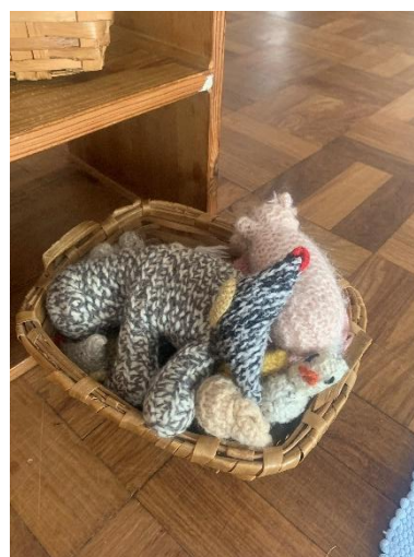
Figura 12 – Materiais disponíveis (animais de lã)