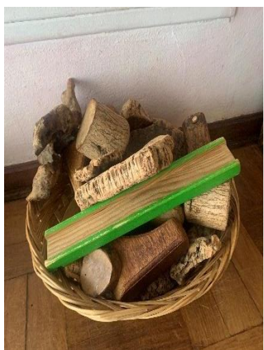
Figura 11 – Materiais disponíveis (pequenos troncos e pedaços de cortiça)