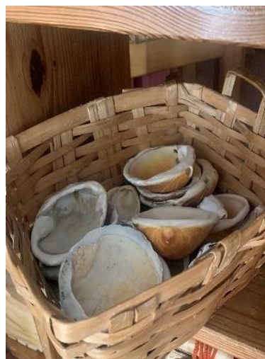
Figura 10 – Materiais disponíveis (conchas)