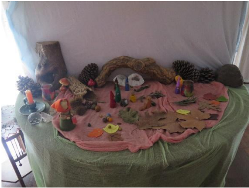
Fig. 5 - Mesa de estação (outono)