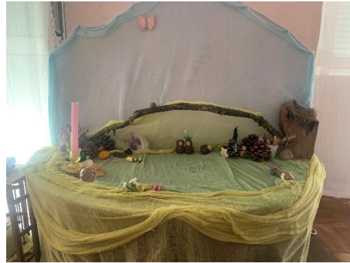
Figura 50 - Mesa de estação (primavera)