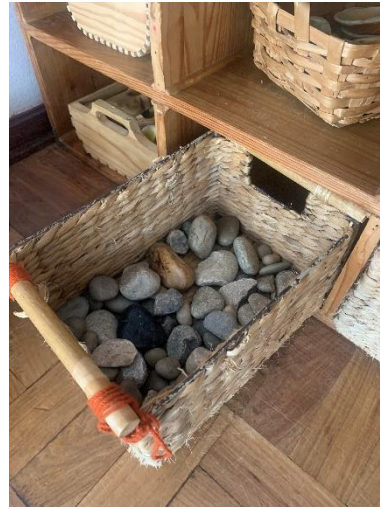
Figura 14 – Materiais disponíveis (pedras)