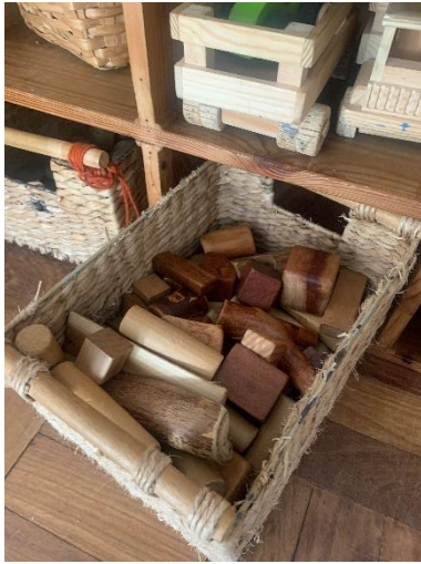
Figura 13 – Materiais disponíveis (sólidos de madeira)