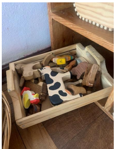
Figura 9 – Materiais disponíveis (animais de madeira)