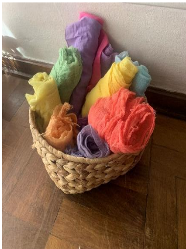
Figura 7 – Materiais disponíveis (lenços)