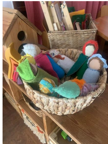
Figura 8 – Materiais disponíveis (bonecas de pano)