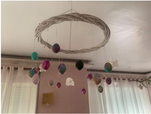
Figura 49 - Elemento decorativo alusivo à Páscoa