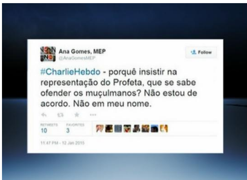
Figura 4. "Tweet" de Ana Gomes difundido no programa de 16/01/2015

No mesmo episódio, depois da sátira à crónica de Boaventura Sousa Santos, também houve espaço, noutra "Pasta Ministerial" para criticar mais um comentário público sobre o mesmo assunto. A opinião foi feita através da rede social Twitter e pertence à eurodeputada socialista, Ana Gomes.