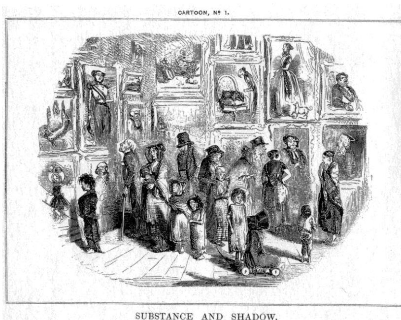
Figura 2. Cartoon da autoria de John Leech, "Substance and Shadow" publicado na revista Punch em 1843, disponível em:

A conjugação entre humor e sátira nos programas de televisão, terá, nesta dissertação e para conseguir cumprir os seus propósitos, primazia sobre todos os outros meios de comunicação. No entanto, especialmente quando se fala de origens na comunicação social, não se deve descurar o papel pioneiro que os cartoons desempenharam, bem como não deverá ser dispensável uma observação sucinta ao que se faz atualmente nos vários jornais portugueses. A história do termo cartoon - publicada - ter-se-á iniciado na revista britânica Punch , em 1843, com um desenho sobre uma exposição de pintura no novo Palácio de Westminster 8 . O cartoon apresenta, na sua maioria, meninos de rua numa exposição onde os aristocratas seriam os principais protagonistas. O principal objetivo terá sido ironizar sobre a forma como os políticos de Westminster se achavam grandes e superiores.