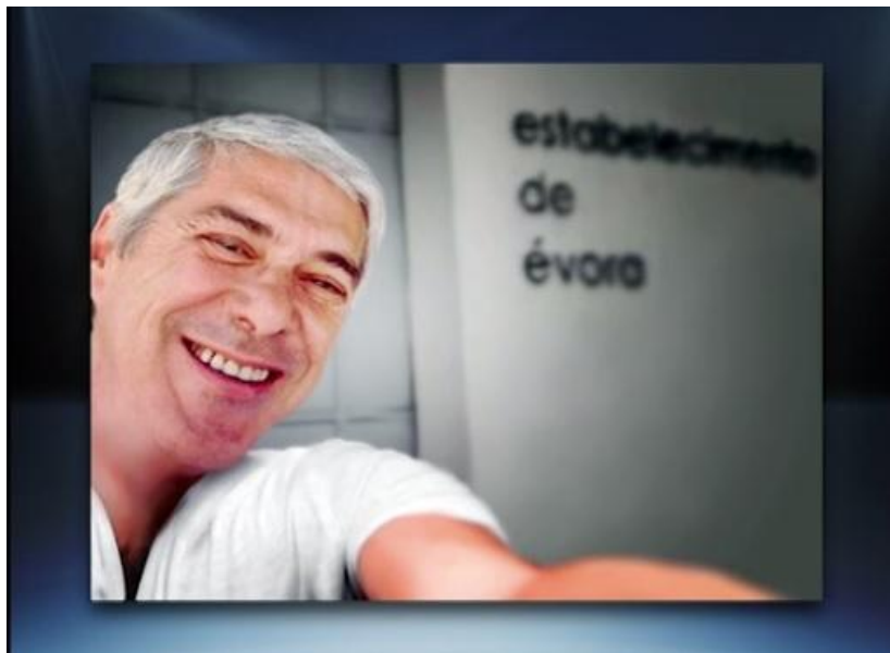
Figura 3. "Selfie" de José Sócrates emitida no programa de 02/01/2015

seu termo, em vez de no seu início. Um dos pontos-chave é a fotografia de José Sócrates à frente do Estabelecimento Prisional de Évora de onde, alegadamente, teria fugido.