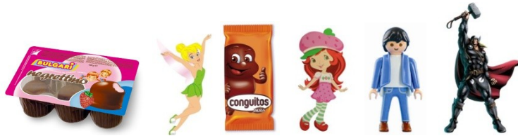
Figura 5 – Ilustração dos personagens selecionados para nomear os bebês

As crianças de origem africana foram imediatamente nomeadas tendo em conta a cor da sua pele: Bomboca e Conguita. Destas crianças apenas o Thor foi nomeado tendo em conta as suas características de personalidade ou comportamentais por serem muito consideradas pelos adultos e destacarem-se aquando da interação com a criança. A sua energia e características induziram à escolha de um personagem de animação baseado na mitologia nórdica, Thor. Foi atribuído o nome de Playmobil ao menino de origem indiana pelo seu aspeto físico de homem em miniatura e cabelo muito certinho .