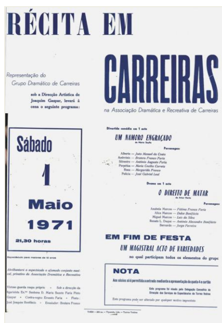
FIGURA 2 - Cartaz de 1971

No período da história do teatro nesta comunidade que vai de 1934 a 1954, os artigos e entrevistas publicados