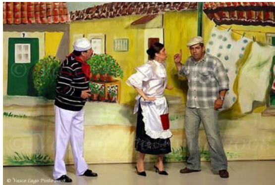
FIGURA 12 - Um sketch da revista Agora é que são elas

programa “Portugal em Directo”, da RTP1, apresentou uma reportagem em direto a propósito da peça Agora é que são elas .