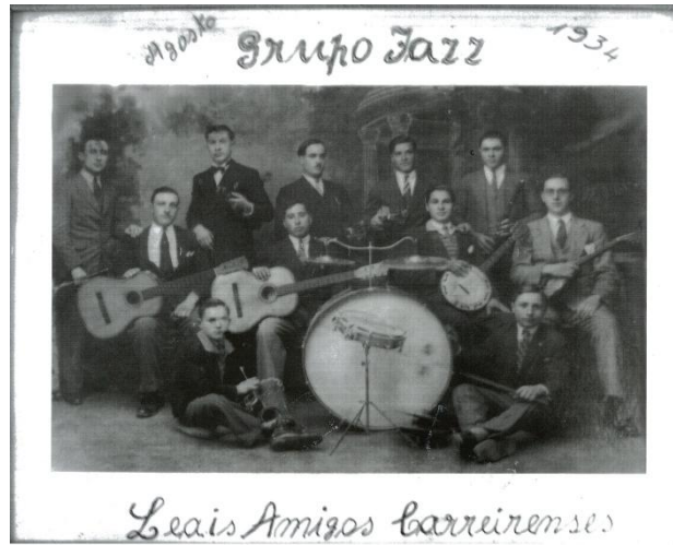
FIGURA 1 - Grupo Leais Amigos Carreirenses

de uma das ruas do lugar de Carreiras, Rua Jazz Leais Amigos ( http://maps.google.pt ).