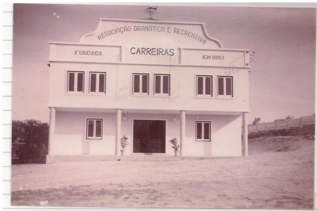
FIGURA 5 - O edifício construído

O edifício construído incluiu um palco com 8m de fundo e 12m de boca de cena, e uma teia para os cenários, e ainda uma sala para 400 espectadores. Foram construídos também dois camarins, um para as senhoras e outro para