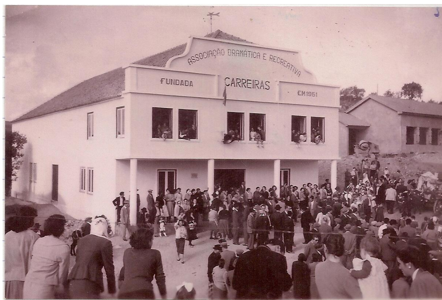
FIGURA 7 - Inauguração da sede da ADR

A construção deste edifício foi acompanhada pouco depois pela construção da escola primária, mesmo ao seu lado, tendo sido inauguradas no mesmo dia em cerimónia que juntou a população e as entidades oficiais numa grande festa (Figura 7). Nas proximidades fez-se mais tarde uma capela, ao topo da mesma rua.