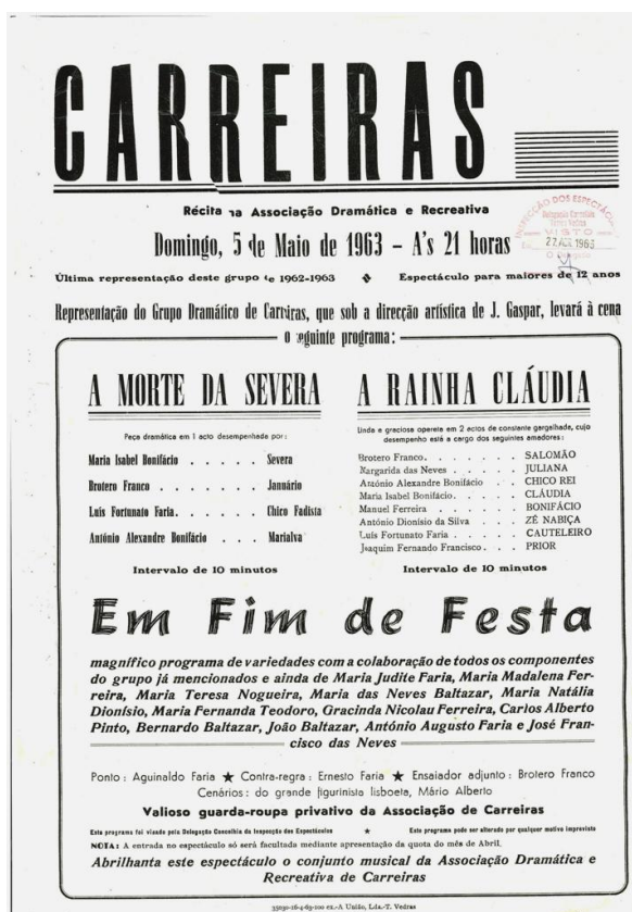
FIGURA 9 - Cartaz de 1963

Junta de Freguesia da Carvoeira, para apoio a jovens e idosos, e, no seu sítio na internet, um agradecimento da Santa Casa da Misericórdia de Torres Vedras pela oferta de bilhetes que reverteram a favor desta instituição.