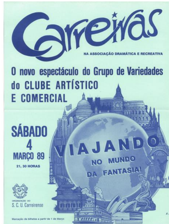
FIGURA 10 - Cartaz de 1989

Esta opção pelo género de teatro de revista é comum à da maioria dos grupos do concelho, na ótica de António Augusto Sales, porque os vários grupos de teatro de amadores eram “geralmente fiéis representantes das revistas cuja empatia com o público assegurava o sucesso de cartaz” (2007:174). Este autor destaca, na revista, como mais representativo, o “Grupo Cénico das Carreiras reaparecido em 1992 (...) com Tesos mas Alegres , revista que a própria cidade abençoou com sucessivas representações de casas