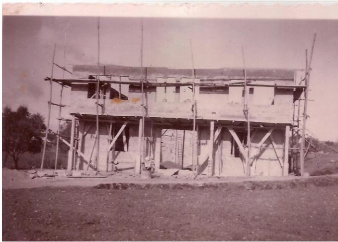
FIGURA 4 - A estrutura do edifício já montada