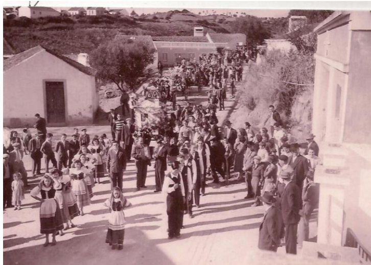
FIGURA 6 - O 1º cortejo de oferendas

provindas das deslocações do Grupo, se salienta o apoio dos carreirenses, que através de cortejos de oferendas e outros processos ajudaram a concluir as obras da sede, para a qual também contribuíram oferecendo mão-de-obra, na sua maior parte gratuita. Realizaram-se com esta finalidade três importantes campanhas: a campanha da madeira, a campanha da telha e a campanha do tijolo. Diz Victor Grilo que para a campanha da madeira, os principais participantes foram os proprietários da Quinta do Espanhol, entre outros; para a obtenção da telha para o edifício, “as senhoras das Carreiras (...) mobilizaram os seus esforços no sentido de angariar fundos”; e para a campanha do tijolo existiram ofertas de algumas empresas, tendo o transporte sido feito por particulares de forma gratuita. Refere ainda que alguns naturais de Carreiras emprestaram dinheiro à Associação, para a obra, que depois foi amortizado ao longo dos anos ( Oeste Democrático , abril de 1977: 8).