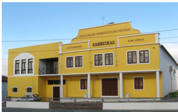
FIGURA 8 - A sede da ADR em 2012