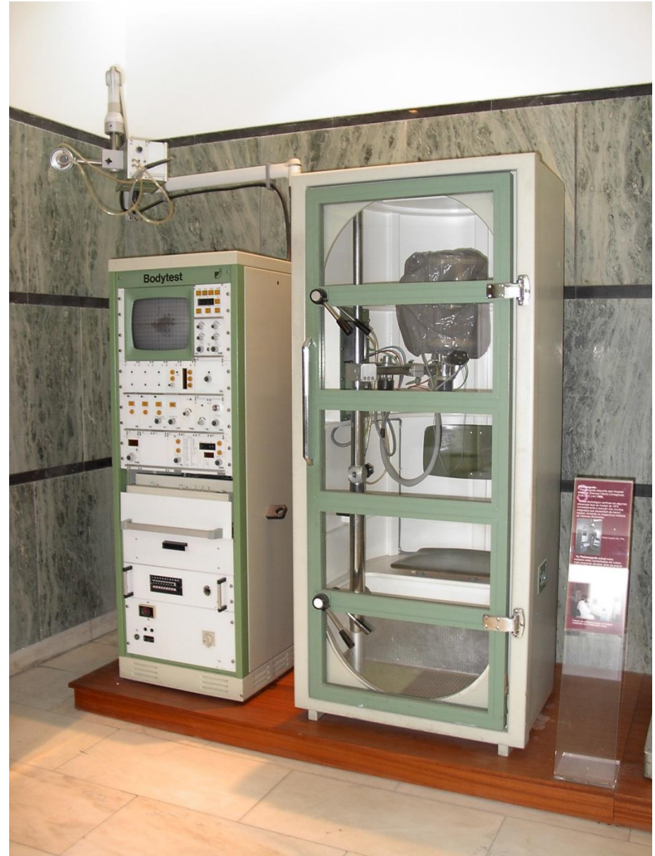
Fotografias do Museu do Hospital Militar de Belém