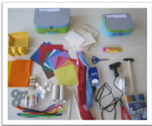
fig.1 - Materiais e ferramentas à disposição das díades participantes.