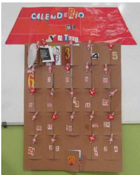
Figura 5. Calendário de Natal. Capturada pela máquina fotográfica própria no âmbito da PPS II