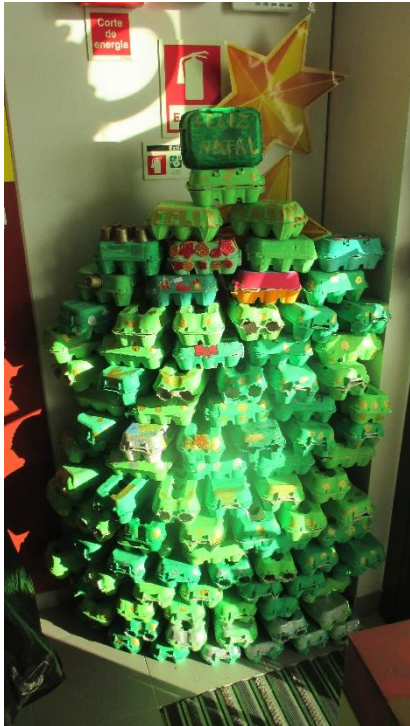
Figura 4. Árvore de Natal. Capturada pela máquina fotográfica própria no âmbito da PPS II