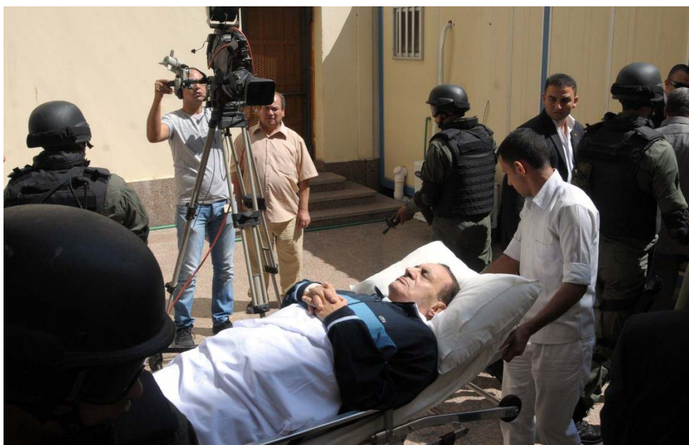
Imagem 7: 3.º Prémio Individual "Pessoas nas Notícias"