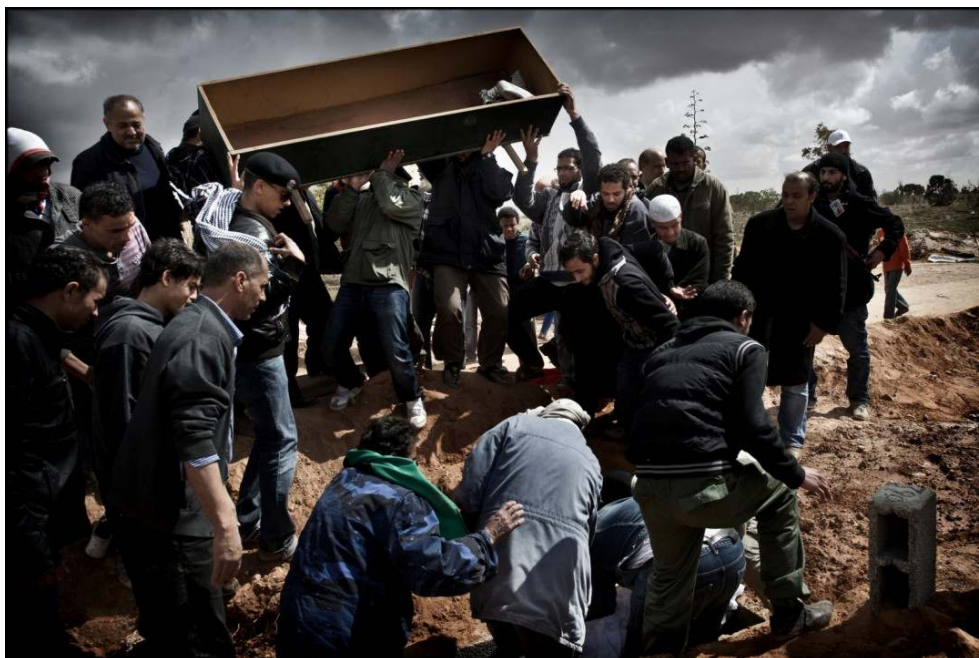
Imagem 5: 1.º Prémio Histórias “Notícias em Geral”