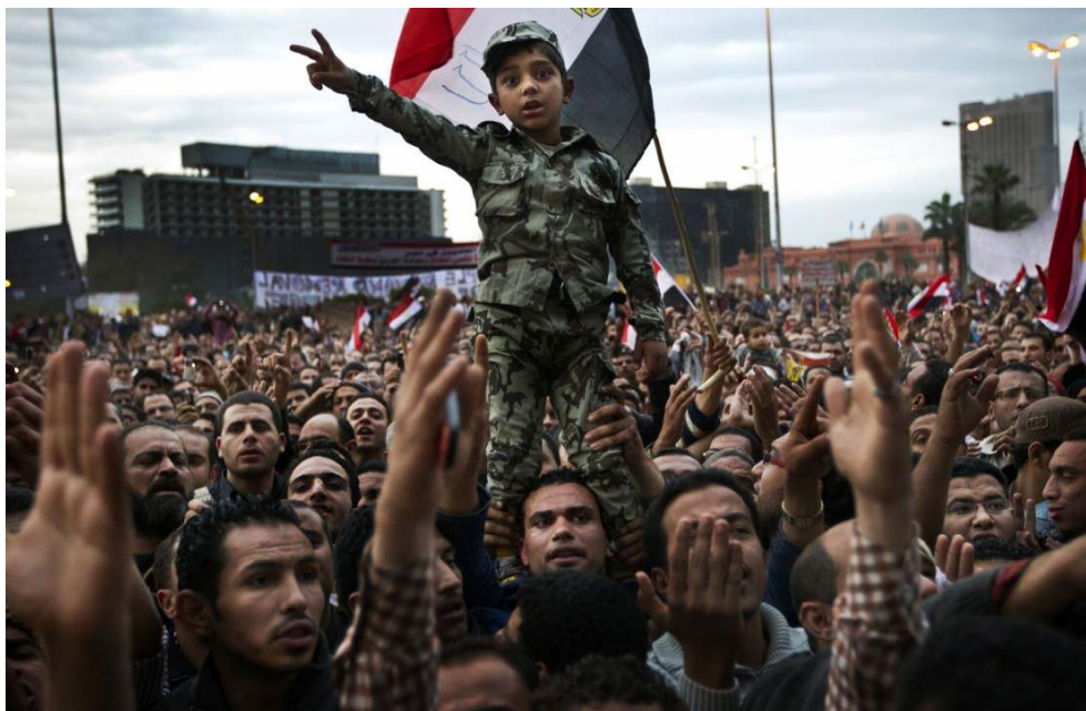
Imagem 3: 3.º Prémio Histórias "Notícias em Destaque"