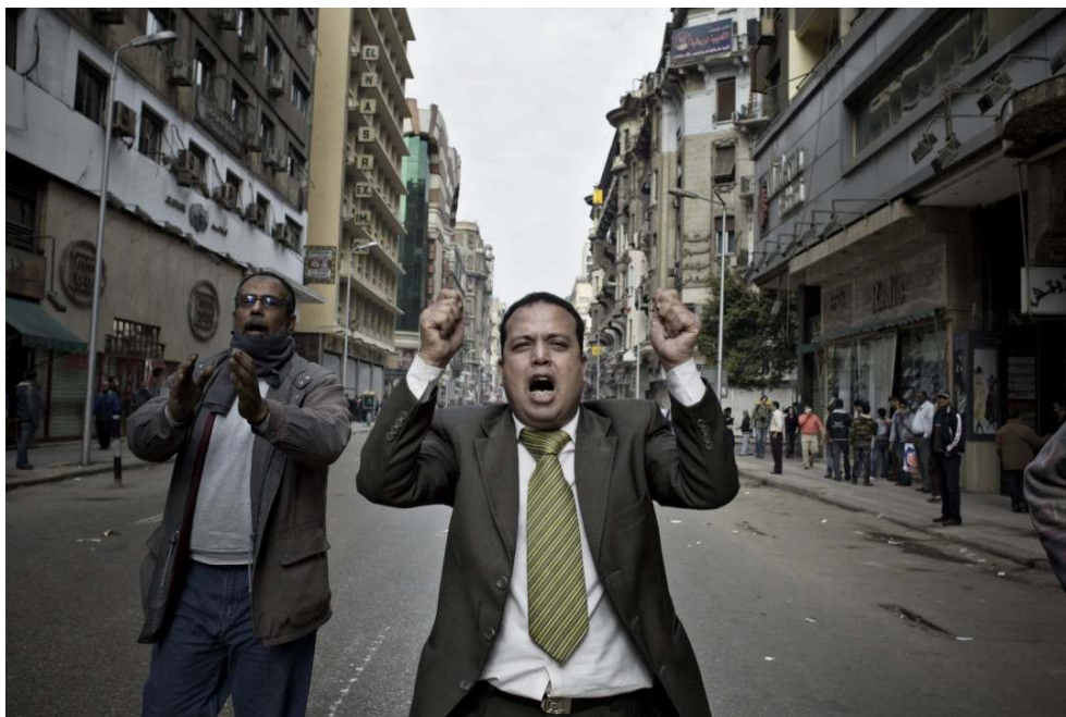
Imagem 2: 3.º Prémio Histórias “Pessoas nas notícias”