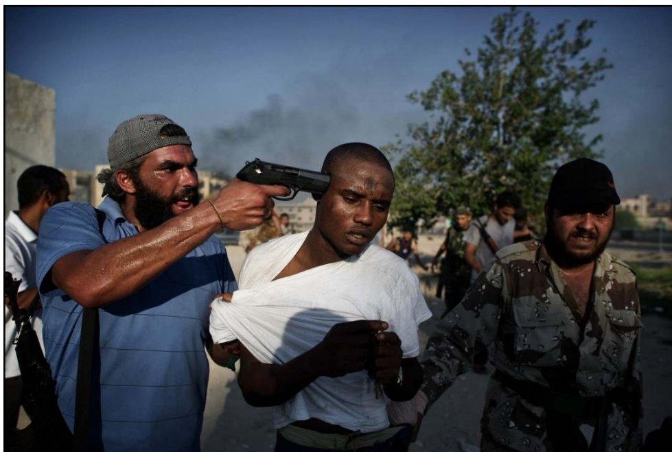
Imagem 4: 1.º Prémio Histórias "Notícias em Geral"