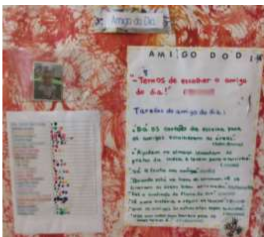
Figura 2. Quadro do “amigo do dia”.

Quando é eleito o novo “amigo do dia”, o mesmo levanta-se, vai buscar a sua fotografia e coloca-a no quadro do “amigo do dia”, dentro de uma mica (cf. Figura 2). As restantes fotografias das crianças que já desempenharam esse papel são colocadas numa capa. Desta forma, não existem repetições e todas as crianças têm oportunidade de o ser. Quando já não existirem fotografias dentro da caixa, todas as fotografias são repostas, de maneira a começar um “novo ciclo”.