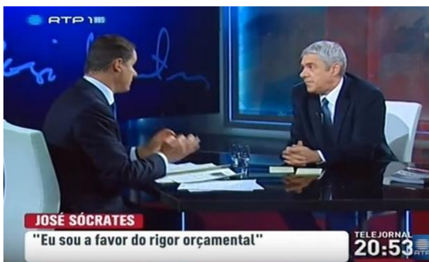
Figura 12: Exemplo de um oráculo no programa “A Opinião de José Sócrates” (RTP1).