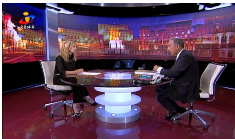
Figura 4: Posição física, em estúdio, de Judite Sousa e Marcelo Rebelo de Sousa em “Os comentários de Marcelo Rebelo de Sousa” (TVI).

Os enquadramentos de imagem aplicados são fundamentais à compreensão da intensidade e do significado da mensagem. Existem vários tipos de enquadramentos que podem ser feitos, desde o plano geral (plano que descreve a cena e o ambiente completo, visto que o zoom out sugere distanciamento) ao plano fechado (que apela mais à emoção, visto que o zoom in sugere tensão e aumento da expectativa) (Oliveira, 2007). 126