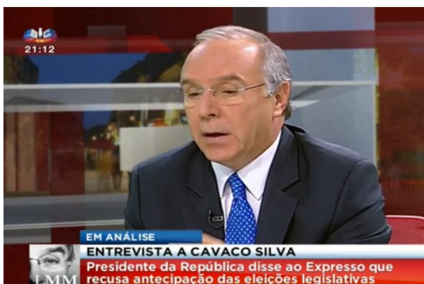
Figura 10: “Plano Próximo” de Luís Marques Mendes em “A Opinião de Luís Marques Mendes” (SIC).