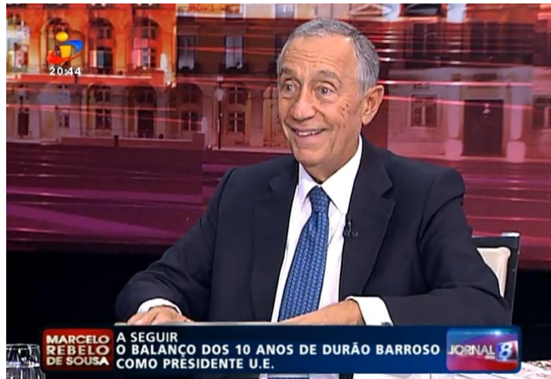
Figura 11: “Plano Médio” de Marcelo Rebelo de Sousa em “Os comentários de Marcelo Rebelo de Sousa” (TVI).

Também a redução do espaço cénico a um pequeno estúdio no qual estão presentes apenas duas pessoas limita precisamente o realizador no jogo de planos que pretende destacar detalhes de aparência ou de expressão. Neste sentido, a leitura destas imagens é complementada e direcionada pelas frases destacadas, ao longo da emissão, de entre as produzidas no discurso oral: os chamados “oráculos”, que ajudam a transmissão de informação aos telespectadores de forma clara, exaltando as informações mais pertinentes, de forma a que, qualquer pessoa que ligue a televisão, compreenda de imediato quem está a ver e sobre o que estão a falar. Seguem-se alguns exemplos de oráculos, uma ferramenta não-oral que facilita a compreensão do discurso oral (fig. 12 e 13):