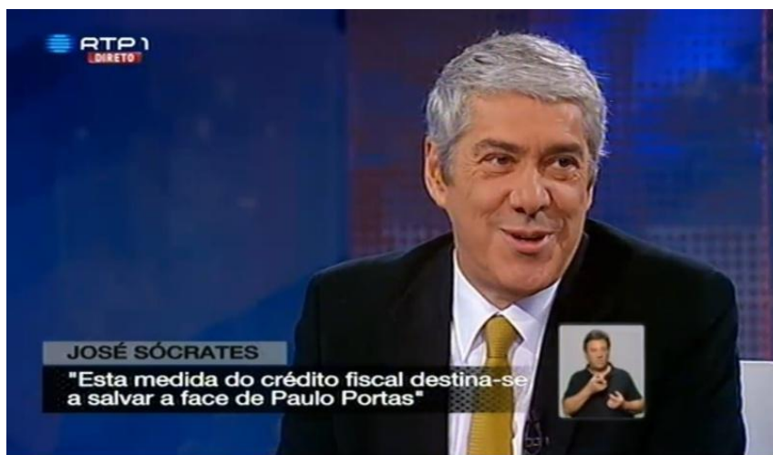
Figura 9: “Plano Próximo” de José Sócrates em “A Opinião de José Sócrates” (RTP1).