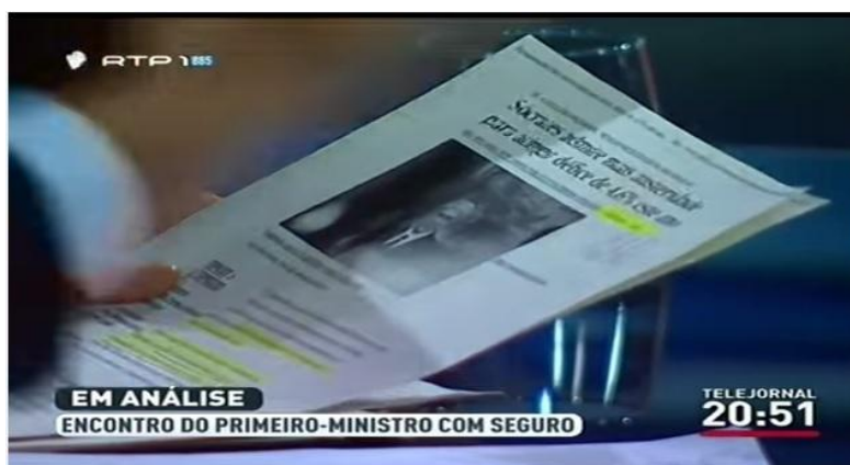
Figura 1: Plano de pormenor dos “arquivos” de José Rodrigues dos Santos, sublinhados a amarelo, do dia 23 de Março de 2014, em “Opinião de José Sócrates” (RTP1).

parte e não correspondeu ao modelo que costuma ser aplicado em “A Opinião de José Sócrates”. Neste dia, o espaço de opinião foi transformado nitidamente em entrevista, mas numa entrevista com um tom declaradamente agressivo e de confronto, onde se vislumbra uma intenção de julgamento do comentador, o que o obriga a defender-se e a levar a disputa argumentativa para terrenos pessoais. Neste diálogo aceso entre ambos, José Rodrigues dos Santos esteve longe de ser cordial e foi mais do que combativo no conteúdo. Basta prestarmos atenção à seguinte afirmação hostil por parte do mesmo - “(...) mas é preciso lembrar que quem começou a austeridade em Portugal foi o senhor.” Para além disso, o jornalista afirma ainda que esteve a ver determinadas declarações de José Sócrates “nos seus arquivos” e lê-as em voz alta (tem inclusivamente em cima da mesa, esses mesmo “arquivos” sublinhados a amarelo, como podemos ver na Fig.1), ao que José Sócrates lhe responde - “Dá-me licença? Já agora, vamos lá então contar a história toda!”, e justifica-se, rematando com - “(...) pode ir consultar os seus arquivos...”.