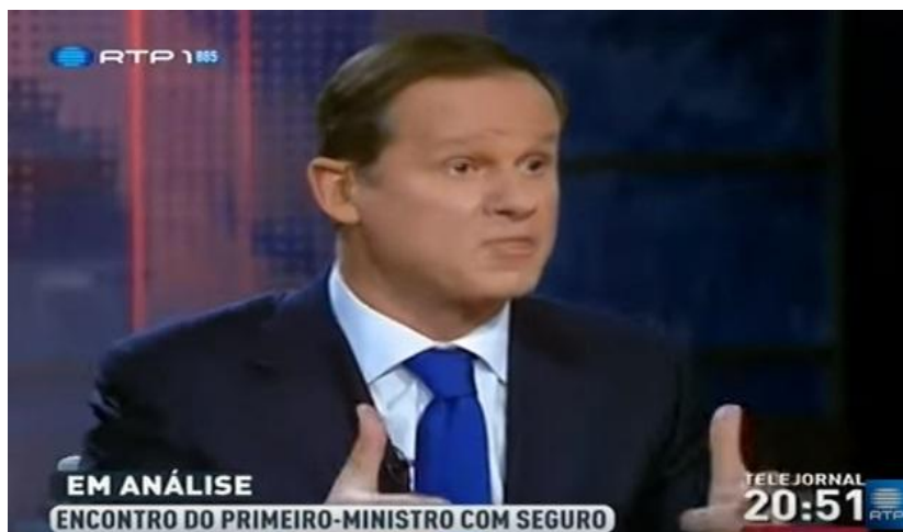
Figura 8: “Plano Fechado” de José Rodrigues dos Santos a apresentar falhas de coerência no discurso atual de José Sócrates em relação a declarações suas de tempos anteriores (RTP1).