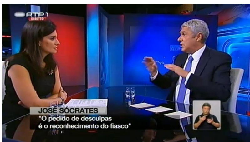
Figura 2: Posição física, em estúdio, de Cristina Esteves e José Sócrates em “A Opinião de José Sócrates” (RTP1).

Também a cenografia aplicada nos espaços das redações de informação é fundamental nos jornais televisivos e os aspetos cenográficos dos estúdios e das redações influenciam as intenções comunicacionais dos profissionais envolvidos nestes espaços e inclusivamente do impacto nos telespetadores (Saraiva, et al. , 2011). Como podemos ver nas seguintes imagens (fig.2, 3 e 4), em todos estes programas, os comentadores encontram-se frente a frente com os jornalistas, o que acentua a ideia de “entre-dois” e pode assumir ou a forma de uma conversa ou de um confronto. Isto porque o posicionamento dos interlocutores no espaço cénico, nestes géneros televisivos, acentua o seu carácter dialogal. Se, no conteúdo, a forma se materializa em conversa ou em confronto, a disposição serve ambas as intenções pois o “olhos nos olhos” facilita a leitura facial quer de quem entrevista/modera, quer de quem responde/comenta. Portanto, esta posição de frente a frente parece-nos eficaz tanto para o género de entrevista como para o género de comentário.