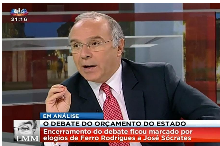
Figura 13: Exemplo de um oráculo no programa “A Opinião de Luís Marques Mendes” (SIC).