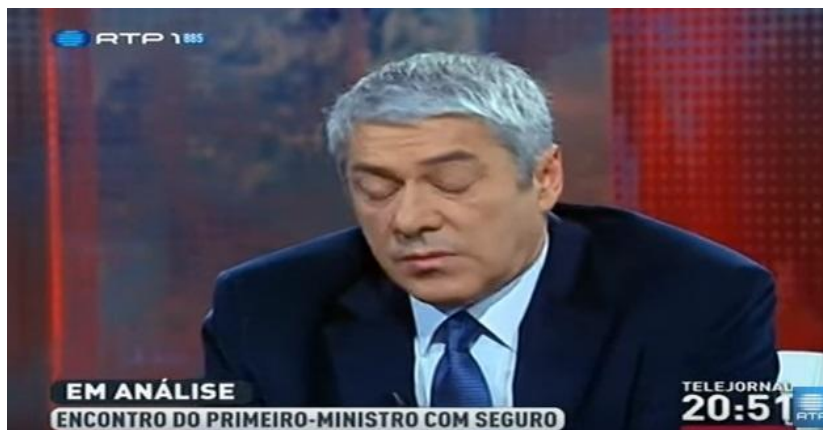
Figura 7: “Plano Fechado” de José Sócrates aborrecido a ouvir as acusações feitas pelo jornalista.