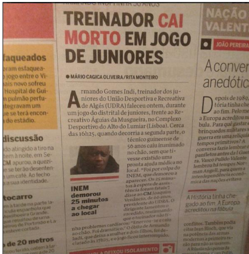
A primeira reportagem assinada no Correio da Manhã

O trabalho do jornalista acaba por depender sempre da entidade que representa. No meu caso, senti dificuldades na execução do meu trabalho, até porque, como fui observando, os jornalistas do Correio da Manhã, talvez como consequência de uma postura mais arrojada do próprio jornal, são várias vezes aqueles que recebem pior tratamento por parte das entidades e/ou adeptos de futebol. A protecção dada aos jornalistas é claramente pouca e em cada saída para o exterior há o risco, cada vez mais elevado, de existirem momentos de tensão ou violência envolvendo os repórteres.