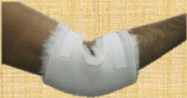
Figura 5. Cotoveleira