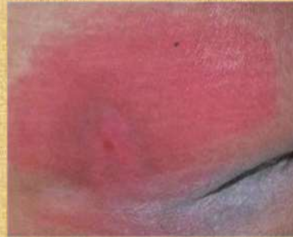
Figura 1. Úlcera Grau I