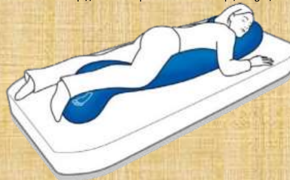
Figura 9. Rolo de posicionamento