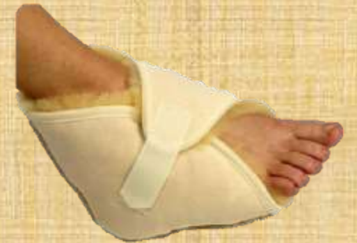
Figura 7. Calcanheira