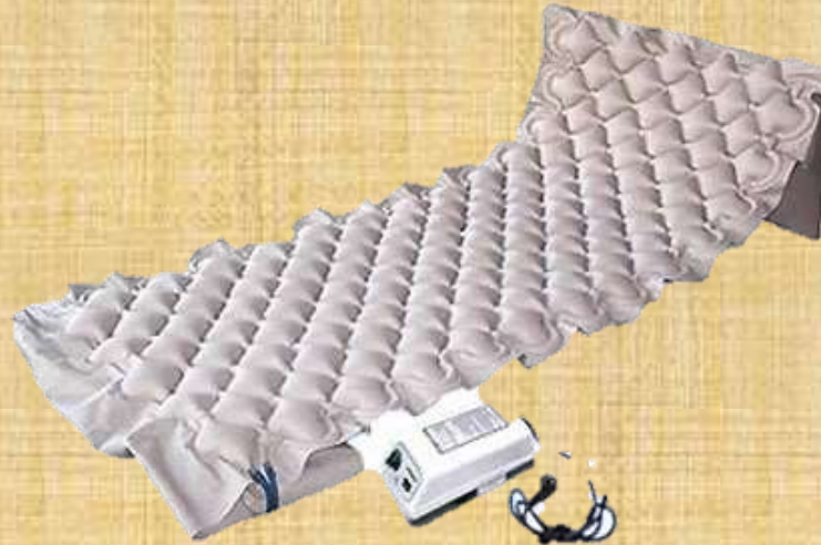
Figura 6. Colchão de pressão alterna