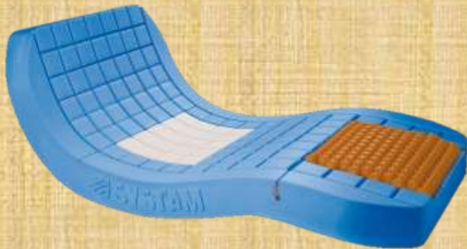
Figura 8. Colchão visco-elástico