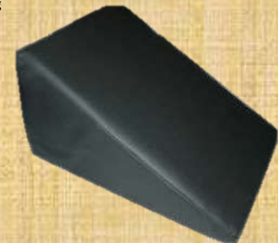
Figura 10. Almofada em cunha