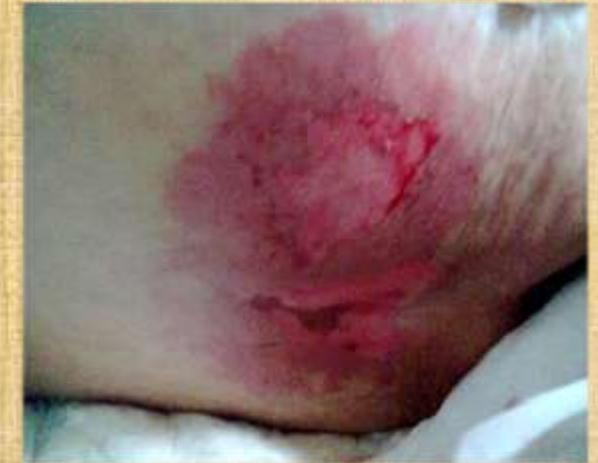
Figura_2. Úlcera Grau II