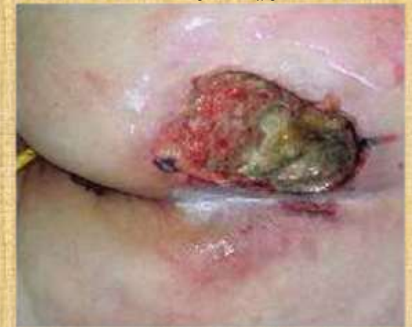
Figura 4. Úlcera Grau IV