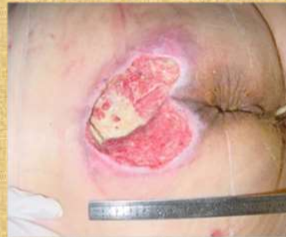
Figura 3. Úlcera Grau III