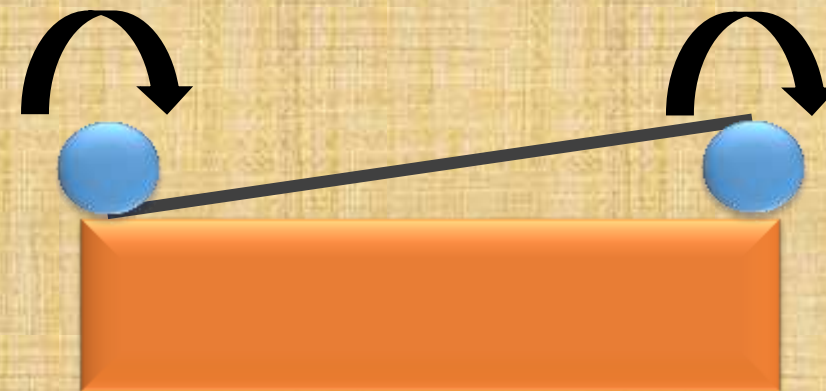
Figura 11. Dispositivo