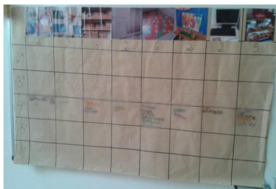
Figura 1. Tabela de gestão das áreas.

Assim sendo, elaborei uma tabela de dupla entrada: na coluna vertical constavam os dias da semana e na coluna horizontal as diferentes áreas da sala e o respetivo número de vagas. Segue-se a Figura 1 com uma imagem da tabela.