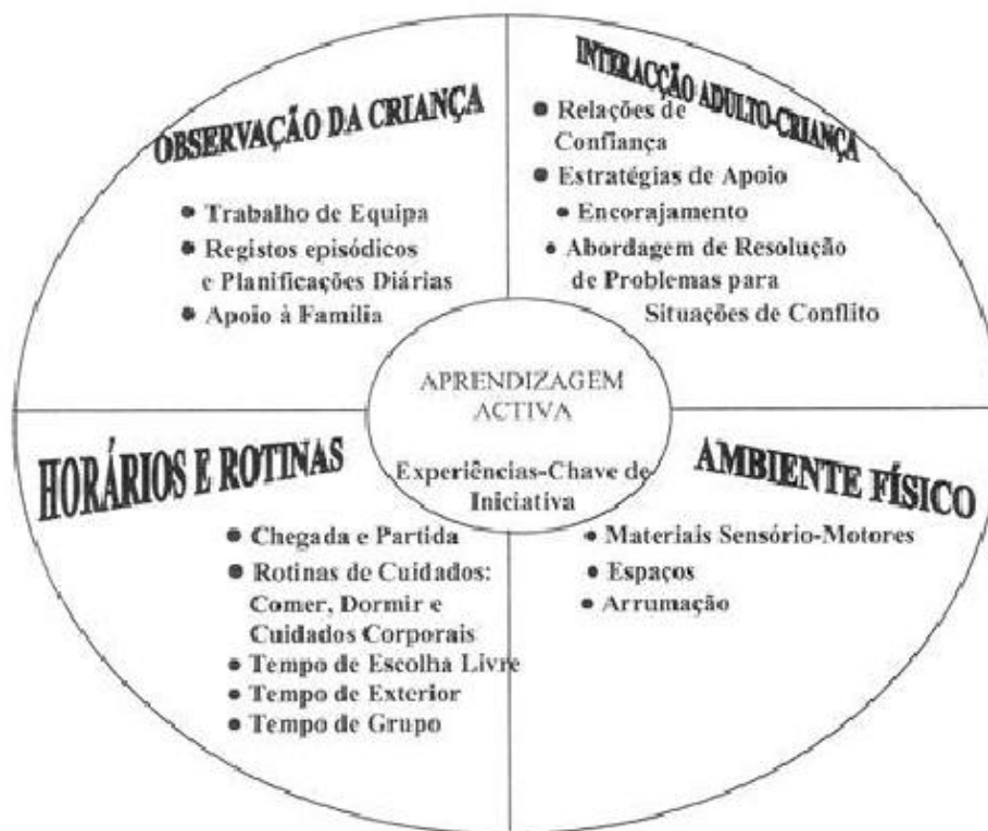
Figura 1. Imagem retirada do Projeto Educativo 2013-2015