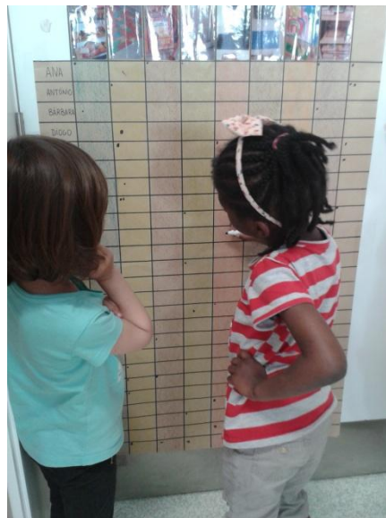
Figura 3. Crianças a preencherem a Tabela de Atividades.

Apesar de haver um controlo das áreas em que as crianças brincavam, a sua autonomia foi garantida. A criança tinha liberdade para trocar de área quando quisesse, sem ter que pedir autorização ao adulto, apenas tinha de verificar se havia vaga. A Figura 3 ilustra algumas crianças a preencherem de forma autónoma a tabela.