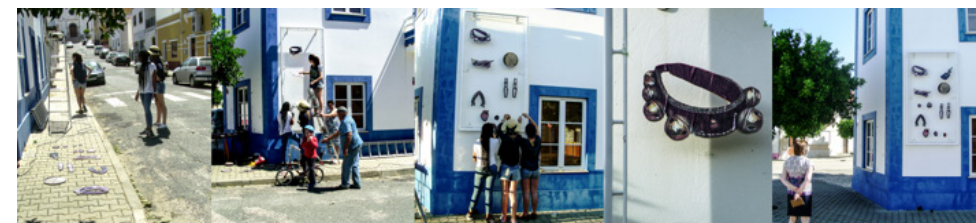
Figura 6 Projeto Museu do trabalho Rural de Abela, memória e oralidade