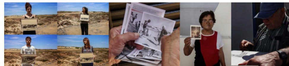
Figura 4 “Memórias das Cabanas da Lagoa de Santo André”

É de salientar o impacto desta experiência no grupo de estudantes que congeminou um processo criativo para apreender uma determinada realidade, completamente diferente da sua, inteirando-se de forma direta das vivências do passado destas pessoas, noutra época e contexto. No processo, foi possível observar que o método excedeu as expectativas do grupo e que a mediação de dispositivos de captura de áudio e imagem intensificou a sua experiência de contacto com a população, aproximando-os da realidade destas pessoas, corroborando empatia pelo património imaterial em causa. Subsequentemente, ressaltamos também o fechamento que se sente numa comunidade deste género – descontinuada – que, contudo, sabe abrir-se à intromissão daqueles que exaltam a sua história, ainda que de forma tão espontânea.