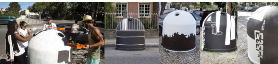
Figura 8 Vidrões em Benfica, com a chancela da GAU, integrados no projeto “Reciclar o Olhar”

Por fim, importa referir o nível de interação social e comunitária que a intervenção artística em vidrões desencadeou naquela freguesia. De facto, a interação com a comunidade deu-se no decurso do trabalho, sempre que os estudantes eram interpelados com diversas questões de ordem estética, o que revela um certo reconhecimento da arte na imagem da freguesia.