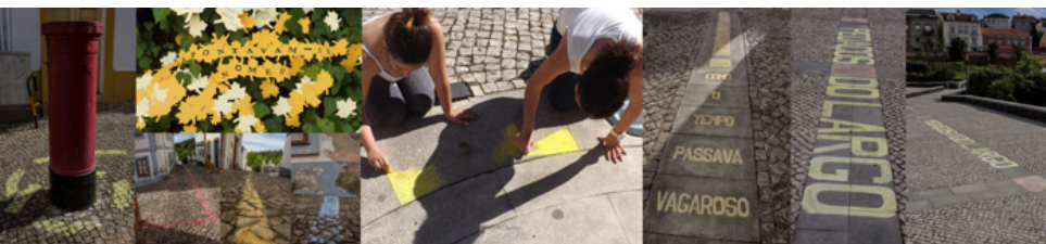
Figura 5 Projeto “Linhas de Cerromaior”

Desta forma, foi possível transpor para um plano material uma memória partilhada dos lugares, mediada pelo discurso literário, que convoca outras dimensões de ordem estética, plástica e comunicacional.