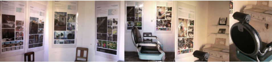
Figura 9 Exposição itinerante na freguesia de Abela – espaço de uma antiga barbearia

Finalmente, prevê-se que a sessão de apresentação e balanço final de todos os projetos e processos desenvolvidos, surja como um momento de introdução da UC aos estudantes inscritos no ano letivo 2015/16 completando, por um lado, um ciclo de trabalho e, por outro, encetando um olhar acerca das potencialidades, desafios, obstáculos, contradições e necessidade de constante adaptação, diálogo, negociação e partilha de experiências que a intervenção artística com a comunidade comportam.