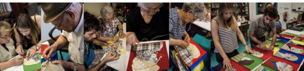
Figura 3 Projeto “A Cor da Idade”

É ainda de referir que, ao longo de todo o processo, os utentes demonstraram-se recetivos à nossa presença e intervenção, participando genuinamente. O dito painel, esse encontrou o seu lugar no novo Lar, algumas semanas depois da nossa residência.