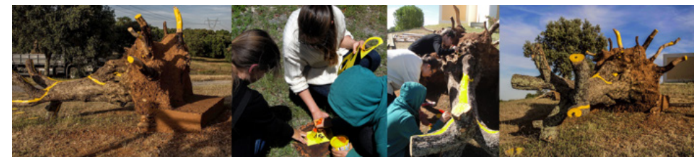
Figura 7 Projeto “Yellow Roots”

Da Giesta, planta que dá nome à herdade, provém a cor amarela que caracteriza a paleta cromática da intervenção plástica, funcionando como elemento unificador de toda a obra. O caráter reflexivo do trabalho aparece representado nas palavras soltas – “Eu Sinto”, “Felicidade”, “Calma” – e através dos diversos desenhos impressos nas rodela com stencil . A expressão “Eu Sinto”, impressa no primeiro fragmento, dá o mote aos visitantes para deixarem a sua marca no local e exprimirem as sensações e estados de alma deste encontro com a natureza. Deste modo, a comunidade é convocada a participar ativamente no trabalho, por meio de um conjunto de palavras e pictogramas (em stencil ) colocados à disposição pelo grupo de estudantes, permitindo ao espetador ser um co-produtor da obra e imprimir a sua expressão individual.