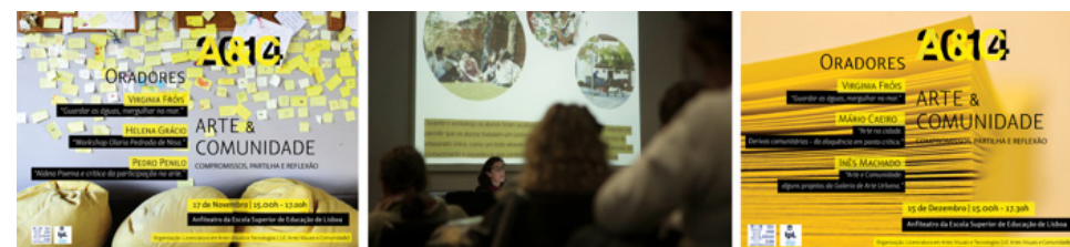
Figura 1 Seminários “Arte & Comunidade – Compromissos, Partilha e reflexão”