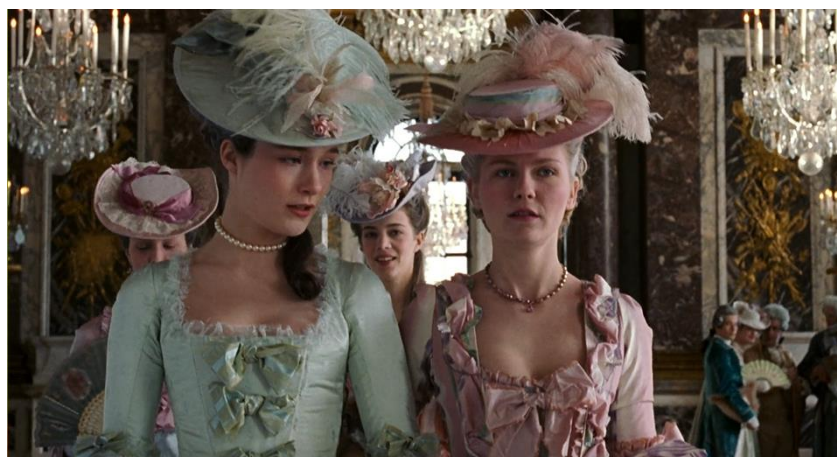
Figura 26. Caracterização de Marie Antoinette (00:37:03).

Antoinette pode ainda sonhar, enquanto Madame du Barry compreende bem as limitações impostas pelo poder e pela posição social.