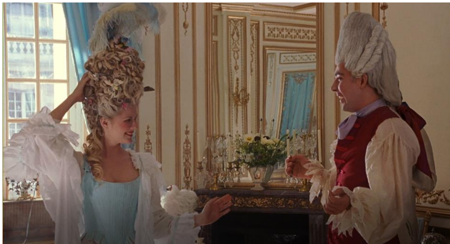
Figura 28. A makeover de Marie Antoinette (00:58:16).

associada ao consumismo feminino, apresentando-o como uma resistência silenciosa ao tédio e à opressão da vida na corte. Chegando ao fim da cena, Marie Antoinette é alvo de uma “ makeover ”, isto é, uma transformação estética, montada à la mode do filme pós-feminista: com hiatos, simplificações e omissões, de forma a transmitir uma certa ‘magia’ no processo secreto da transformação. Esta “ makeover ”, que habitualmente revoluciona a pobre aparência do visado, apenas deixa Marie Antoinette ainda mais extravagante, como que corroborando o seu estilo de vida. É como se a realizadora lhe dissesse: “Estás a ir bem, arrisca mais”. Assim, o filme sugere que, num ambiente onde as mulheres têm tão pouco poder real, a atração pela moda e no luxo pode ser vista como uma forma de agenciamento e expressão pessoal, desafiando as normas patriarcais que desvalorizam estas práticas.