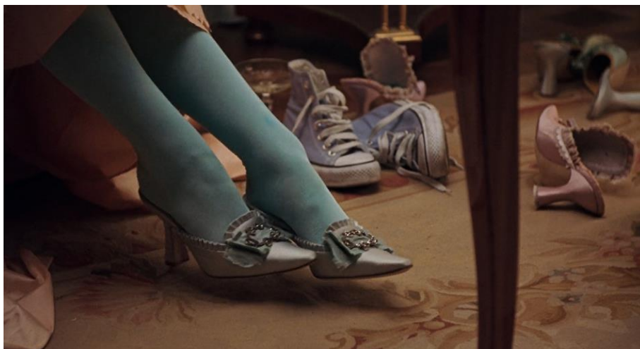
Figura 1. Os ténis Converse azuis (00:55:54). 37

Arislane de Oliveira Straioto destaca a harmonia que existe entre os Converse e a estética rococó dos restantes adereços devido ao uso de tons pastel (2010, 23-24). Há um deslocamento no tempo histórico, mas não ao nível do estilo. Rachel Vorona Cote reforça esta ideia, defendendo que, no ritmo alucinante da montagem ao som da canção “I Want Candy” dos Bow Wow Wow, os ténis Converse nem parecem desajustados (2021, s.p.).