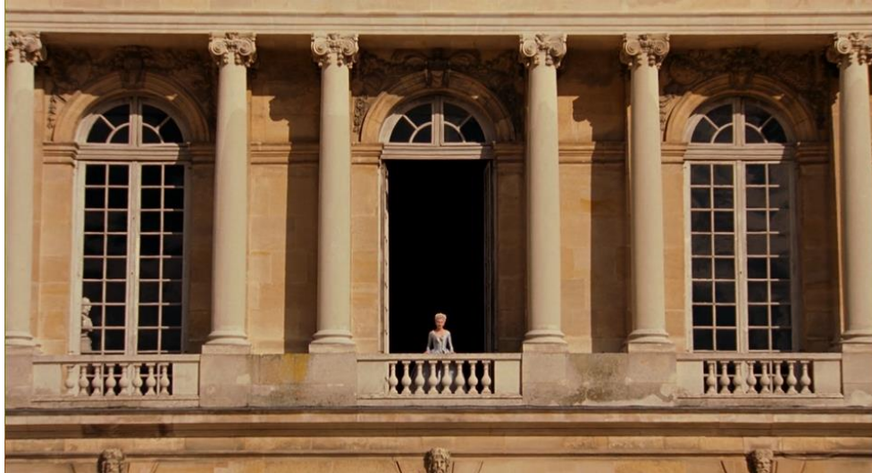
Figura 24. Marie Antoinette sozinha numa varanda de Versalhes (00:38:56).

A protagonista usa um vestido azul relativamente simples e permanece estática na varanda de uma fachada pouco ornamentada enquanto a câmara se afasta dela, reforçando o seu sentimento de isolamento, solidão e pequenez. Apenas o exterior está iluminado, não sendo possível ver o interior do palácio. Atrás de Marie Antoinette, vê-se apenas uma total escuridão. Metaforicamente, não há nada nem ninguém atrás dela para a apoiar: naquele momento, está sozinha numa corte onde se intensifica o desagrado à sua pessoa.