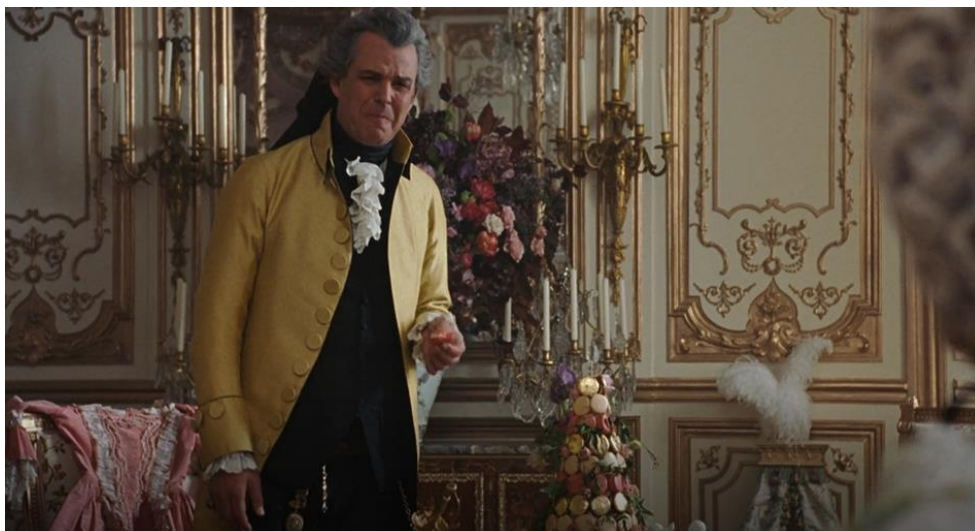
Figura 2. O Imperador Joseph prova um macaron cor-de-rosa (01:15:59).

Poder-se-á argumentar que os macarons historicamente autênticos simbolizam a estrutura rígida de Versalhes, enquanto os seus equivalentes cor-de-rosa, tonalidade característica desta interpretação de Marie Antoinette, simbolizam a jovem rainha. Neste momento da sua vida, os dois são indissociáveis. A repulsa do irmão pelos macarons pode ter um duplo sentido: à superfície, o Imperador Joseph estranha os macarons porque é austríaco e não está familiarizado com eles; a um nível mais profundo em termos dramaturgicos, desaprova os hábitos da irmã. Porventura, a repulsa com que manuseia o macaron , isto é, aquilo que simbolicamente representa Marie Antoinette, sinaliza a reprovação do irmão relativamente ao seu estilo de vida.