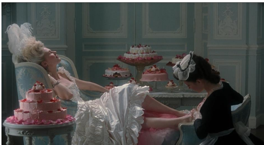
Figura 10. O primeiro plano do filme Marie Antoinette (00:01:15).