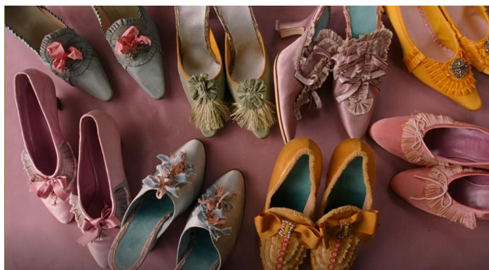
Figura 22. Sapatos ‘Blahnik’ (00:57:02).

Sofia Coppola usa frequentemente a mise-en-scène e a sequência de planos para transmitir a trajetória psicológica da protagonista. Na montagem ‘videoclipe’ da extasiante cena de compras ao som de “I Want Candy”, vêem-se movimentos rápidos, grandes planos estilizados e enquadramentos decididamente subjetivos que criam uma sequência dinâmica e que destacam a superficialidade e o hedonismo da vida de Marie Antoinette em Versalhes. Há até uma sequência de planos de sapatos cuja função é apenas estética: os sapatos movem-se de plano em plano aos 57 minutos, como se dançassem ao som do ritmo alucinado de “I Want Candy”. Se, num exercício de imaginação, mantivermos a técnica de montagem e a escala de planos, mas substituirmos os bolos elaborados por bolachas simples, o espumante por refrigerante, os colares de diamantes por bijuteria de aço inoxidável e zircónia, os ‘Blahniks’ por ténis Converse e a requintada sala do Palácio de Versalhes por um quarto num qualquer subúrbio, estaremos perante um filme de adolescentes. Os enquadramentos subjetivos refletem o ponto de vista pueril da jovem rainha, cercada por opulência e desligada da realidade, o que acentua a atmosfera de fantasia e a sua fuga à responsabilidade.