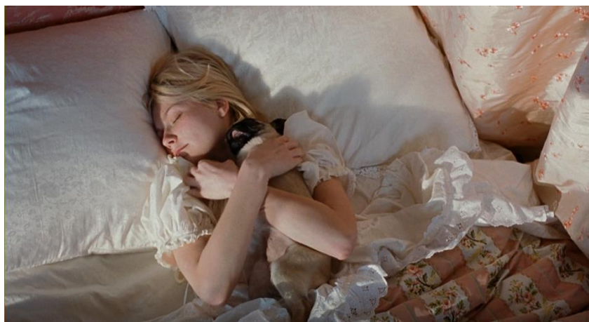
Figura 21. Marie Antoinette, ainda Maria Antonia, a acordar (00:02:51).

O plano Masterpiece precede, então, um outro plano médio da jovem Marie Antoinette ainda deitada, abraçando o seu cão Mops como se pedisse mais cinco minutos de sono, em que se ouve a continuação da narração: “ My youngest daughter, Antoine, will be queen of France ” (“A minha filha mais nova, Antoine, será rainha de França”). O intercalar de grandes planos subjetivos, raros no filme histórico, com um canónico plano Masterpiece provoca, no mínimo, estranheza. A escolha de planos estabelece, desde início, os deslocamentos históricos e a inclusão despidorada das marcas autorais da realizadora.