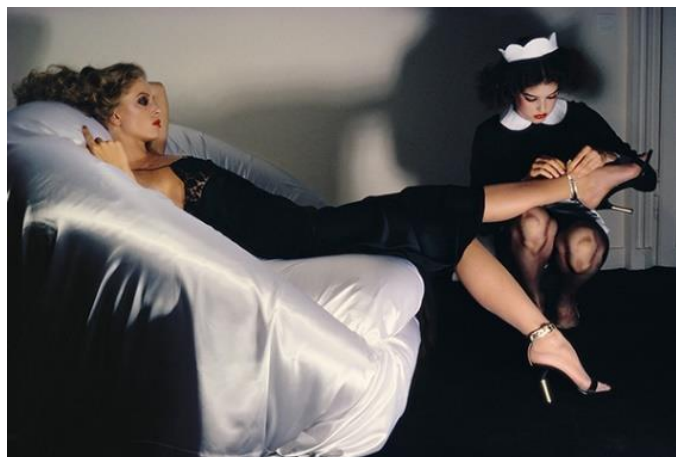
Figura 11. A fotografia de Guy Bourdin que inspirou o primeiro plano.

Ao contrário de outras produções que utilizam música contemporânea apenas para atrair um público mais jovem e explorar o caráter cool do anacronismo sem um grande compromisso narrativo, em Marie Antoinette (2006) os anacronismos musicais são usados para enriquecer a narrativa e explorar dramaturgicamente a atemporalidade das emoções humanas. Sofia Coppola procurou usar a música da sua juventude, recorrendo às suas próprias referências, para contar a história da rainha adolescente: