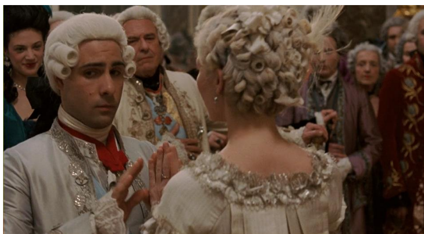
Figura 19. Louis Auguste amedrontado na dança do casal real (00:20:03).

destacar a imensidão da sala de festas, fazendo os personagens parecerem pequenos e quase perdidos pelo meio da opulência do ambiente. Therése Andersson (2011, 106), por exemplo, aponta o caráter agorafóbico desta cena, já que os planos gerais são intercalados com planos médios e grandes planos de Marie Antoinette e Louis Auguste, revelando os seus olhares vazios e enfatizando o constrangimento e tensão do momento. Além disso, os ângulos neutros e os enquadramentos estáticos contribuem para uma sensação de estagnação, refletindo a pressão e a falta de controle dos personagens sobre o rumo das suas vidas. Estas partes reforçam o desconforto emocional do casal e o sufocante peso das expectativas que sobre ele pesam, além de sublinhar a rigidez e o lado cerimonial da vida em Versalhes.