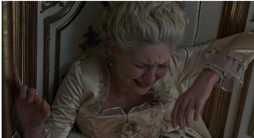
Figura 23. Marie Antoinette chora a humilhação sofrida perante a corte (00:57:02).

Na outra face da moeda, na cena imediatamente anterior à mencionada, o trabalho de câmara procura mostrar a crueza do desgosto de Marie Antoinette. Num plano sequência que a segue pelos corredores de Versalhes logo após o nascimento do seu sobrinho, Marie Antoinette é alvo de olhares reprovadores e críticas por ainda não ter concebido um herdeiro para o trono francês. O plano acompanha-a quase sem cortes até chegar ao quarto. Quando fecha a porta do seu refúgio, desfaz-se em lágrimas. O enquadramento, recorrendo principalmente ao grande plano, não deixa escapar as macro e microexpressões da protagonista, que se deixa cair até ao chão encostada à parede.