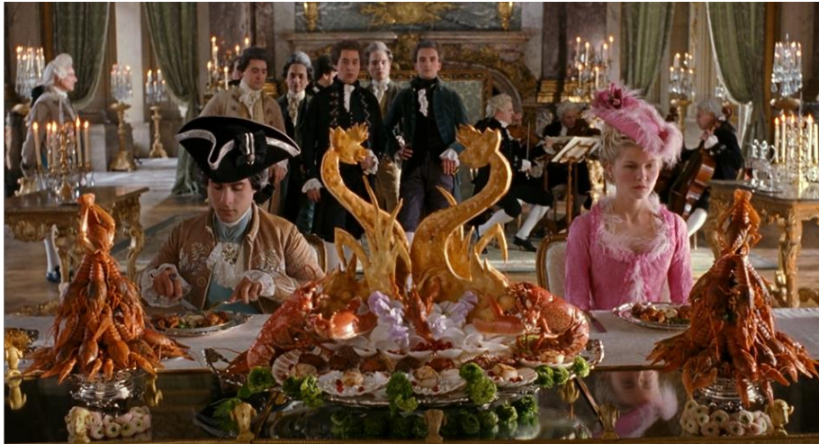
Figura 16. Terceira representação da refeição do par real (00:40:47).

sua rotina é substituído por uma expressão escarnecedora. Nesta cena, a protagonista já opta pelo vestuário cor-de-rosa vibrante que lhe é característico, marcando o momento em que percebe que terá de procurar divertimento fora do matrimónio que não a satisfaz.