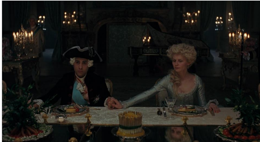
Figura 18. Última representação da refeição do par real (01:54:12).

A representação da refeição em casal nestes moldes só volta a surgir no fim do filme, durante o motim do povo parisiense em Versalhes. É a última refeição do casal no palácio. Pela primeira vez, não há público e parece haver uma cumplicidade inédita à mesa entre marido e mulher.