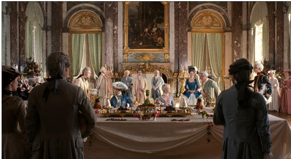
Figura 14. Primeira representação da refeição do par real (00:25:38).

de água à dauphine , pois nem o dauphin nem ela estão autorizados a servir o seu próprio copo. Enquanto os dois comem, os cortesãos observam.