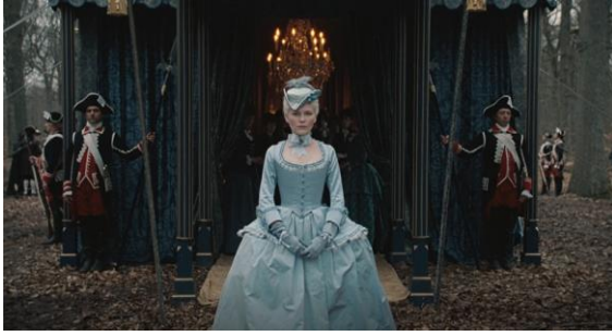
Figura 4. Marie Antoinette conhece o rei e o dauphin (00:08:27).