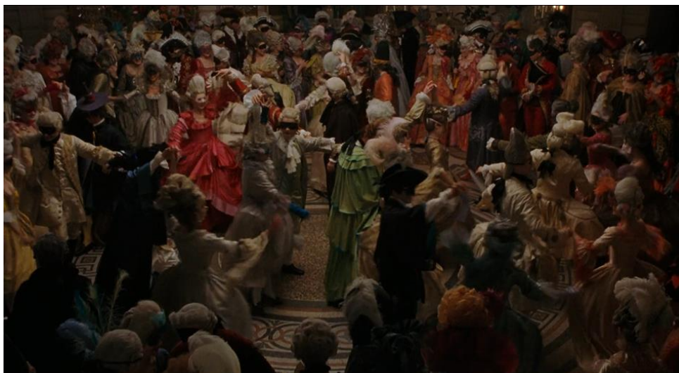
Figura 7. Baile de máscaras em Paris (00:59:41).

A coreografia do baile quase parece orgânica. Os pares dançam rodopiando e saltando junto uns aos outros, sem guardar espaço entre eles, numa coreografia que apenas lembra vagamente as danças típicas da época. A Duquesa de Polignac puxa alegremente Marie Antoinette para dançar por entre a multidão embriagada – ao contrário do costume da época, segundo o qual as mulheres teriam de esperar um convite para se juntar à pista de dança. Fora da pista, mas sem haver uma clara separação entre dança e convívio, os convidados conversam alegremente, namoriscam e beijam-se sem critério nem o decoro que a época exigia nestas circunstâncias.