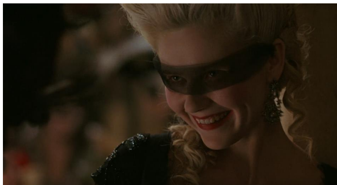
Figura 8. A máscara de tule de Marie Antoinette (01:02:01).

Faz-se um paralelismo entre a liberdade de Paris e o ambiente controlado do palácio. Apesar de as máscaras terem sido simplificadas para evitar a distração do espectador, o ambiente do baile não é menos opulento. No entanto, ao contrário de Versalhes, onde os personagens trajam mais frequentemente de tons claros – à exceção da Madame du Barry – os convidados do baile ostentam cores garridas, como o vermelho, o cor de laranja, o verde e o azul. Paris, com o seu ambiente vibrante e despreocupado, torna-se numa metáfora para o desejo de escape de Marie Antoinette, representando um espaço onde a rigidez da corte de Versalhes é desafiada e a rebeldia encontra um local de expressão. Esta cena funciona, assim, como um vislumbre corpóreo da vontade de Marie Antoinette: ser livre e expressar-se autenticamente.