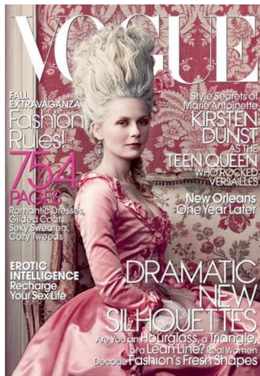
Figura 29. Kirsten Dunst na capa da revista Vogue , como Marie Antoinette.

Por outro lado, Marie Antoinette também é vista como uma it-girl adolescente, semelhante a qualquer celebridade contemporânea, capa de revista e influenciadora de uma massa de jovens (Holthausen 2012, 70). Esbatem-se as fronteiras entre rainha histórica e figura pública contemporânea nesta interpretação de Marie Antoinette, que valeu a Kirstin Dunst um lugar na capa da revista Vogue . No número de setembro de 2006, surge a atriz principal de Marie Antoinette (2006) vestida à la mode de Versalhes, descrita como “rainha adolescente” (Russo 2024, 136).