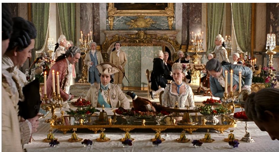
Figura 15. Segunda representação da refeição do par real (00:36:21).

A segunda vez que esta refeição é representada, recorrendo ao mesmo plano de conjunto mas ligeiramente mais aproximado, surge numa montagem que condensa o dia-a-dia de Marie Antoinette – a cerimónia do acordar, a missa e a refeição teatral – que visivelmente a entedia.