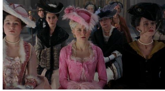
Figura 5. início dos anos de excesso (01:15:59).