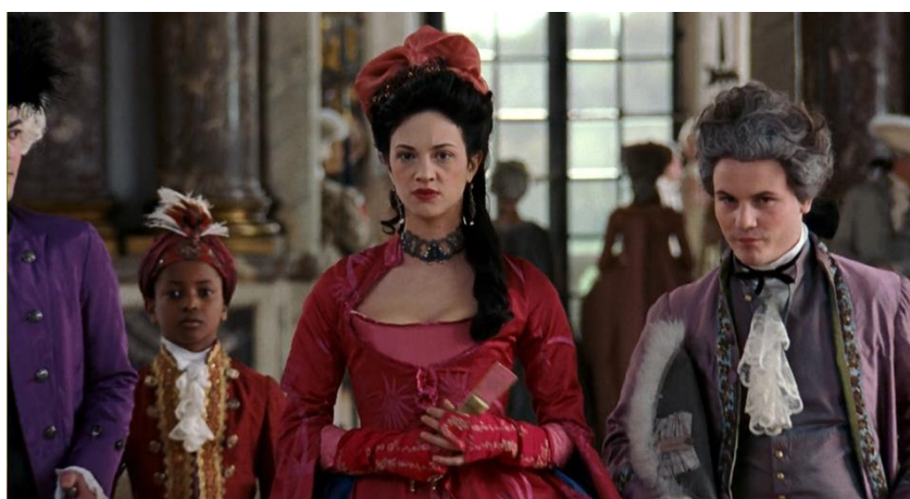
Figura 27. Caracterização da Madame du Barry (00:37:03).