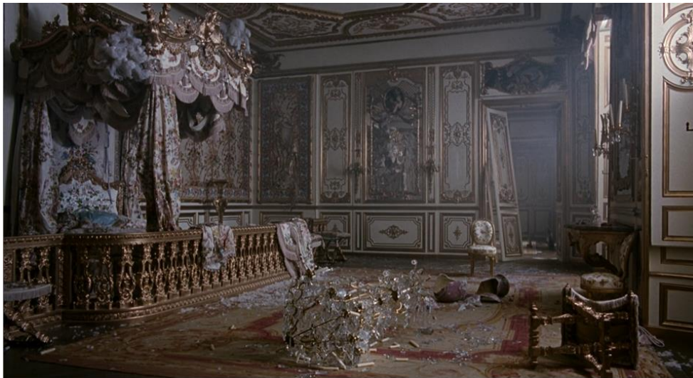
Figura 12. O último plano: o quarto de Marie Antoinette destruído (01:55:36).

Por fim, o último plano do filme, sem pessoas nem movimento, mostra o quarto de Marie Antoinette destruído, após a invasão dos revolucionários. Ouve-se a canção “All Cats Are Grey” dos The Cure, lançada em 1989, que começa durante o plano estático e continua no genérico, desta vez a preto e branco. O cor-de-rosa é deixado para trás, terminando o filme num tom sério, raramente usado. A canção começa com batidas lentas de bateria, seguindo-se uma melodia eletrónica simples. O arranjo minimalista e a letra cantada em tom monocórdico invocam um sentimento melancólico e desolador. O verso “ All cats are grey in the dark ” (literalmente “Todos os gatos são cinzentos no escuro”) sugere a ambiguidade histórica da personagem que o filme, na sua totalidade, procurou evidenciar – de noite, todos os gatos são pardos, e, na realeza, todos os nobres são considerados vilões. O tema musical transmite um sentimento de uniformidade e perda de identidade na escuridão, sugerindo, assim, a injustiça com que a História tratou Marie Antoinette.