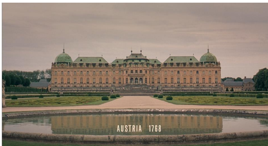
Figura 20. Plano Masterpiece do Palácio de Schönbrunn (00:02:34).

by marriage ” (“A amizade entre a Áustria e a França deve ser reforçada pelo matrimónio”).