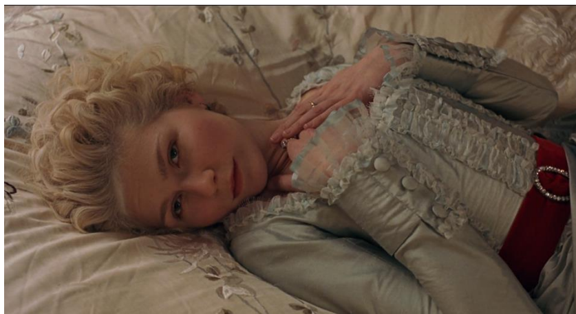
Figura 3. Cinto vermelho que Marie Antoinette usa relembrando o caso com Fersen (01:15:59).

cinto vermelho, com a fivela adornada por brilhantes de estilo mais contemporâneo e cor invulgar para a personagem, contrastando com o vestido rococó azul-bebé.