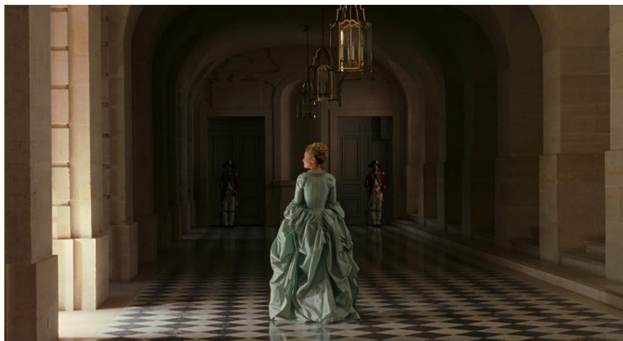
Figura 25. Louis Auguste parte para uma caçada, deixando Marie Antoinette sozinha (00:47:08).

deixando Marie Antoinette sozinha – com exceção de dois guardas, ao fundo – num átrio invulgarmente simples.