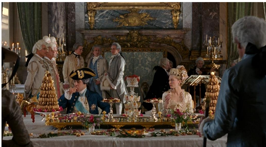
Figura 17. Quarta representação da refeição do par real (00:53:35).

A quarta refeição é consumida ao som do burburinho dos cortesãos, até a Condessa de Noailles a interromper para anunciar o nascimento do filho do Conde e da Condessa de Provence. A humilhação que o acontecimento trouxe a Marie Antoinette leva-a finalmente a refugiar-se numa vida de excessos, começando, assim, a sua fase mais rebelde.