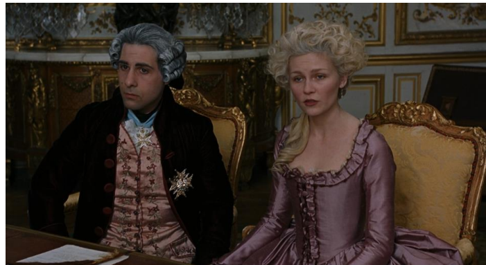
Figura 6. Marie Antoinette recebe a notícia da instabilidade em Paris (01:47:29).