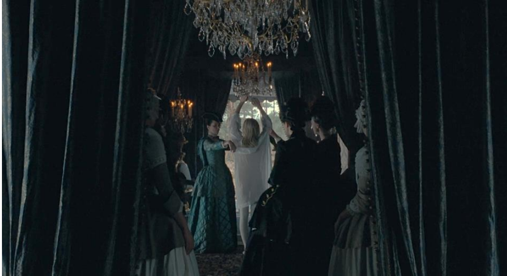
Figura 13. Maria Antonia transforma-se em Marie Antoinette (00:08:02).

Reforça-se, com esta cena, a vontade de demonstrar a teatralidade de Versalhes e os rígidos costumes da corte francesa em oposição à puerilidade de Marie Antoinette, de apenas 14 anos. A adolescente, que reage com tristeza quando o seu cão de estimação, Mops, é arrancado dos seus braços, pois não o pode levar consigo para a nova vida em França, é vestida e arranjada à la mode de Versalhes, mas não deixa a sua ingenuidade para trás. Mais adiante no filme, em reunião com o Embaixador Mercy que a aconselha seriamente acerca da consumação do matrimónio, Marie Antoinette termina a delicada conversa perguntando com entusiasmo se o Mops já está a ser trazido para a corte francesa, para impaciência do Embaixador, que a lembra que o rei tem a seu cargo assuntos mais importantes a tratar.