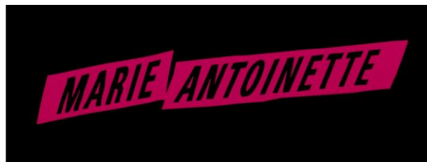
Figura 9. Título do filme a cor-de-rosa (00:01:22).

to do for pleasure ” (“O problema do lazer, o que fazer por prazer”), surge pela primeira vez Kirsten Dunst no papel de Marie Antoinette, deitada num divã e retirando um pouco da cobertura de um bolo com o dedo, ao mesmo tempo que encara a câmara com um ar divertido, em modo de desafio. Percebemos logo o tom transgressor do filme. Mas as referências contemporâneas desta cena não se esgotam na banda musical. Jheison Holthausen nota que o filme começa como um videoclipe, apresentando os nomes do elenco e o título do filme a cor-de-rosa com um tipo de letra contemporâneo, em itálico, sem serifas, de linhas retas e impactantes (2011, 10).