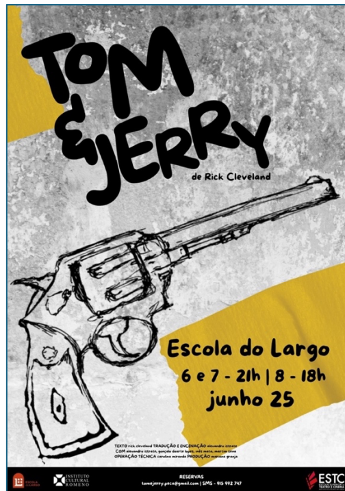
Figura 1 - Cartaz da peça

A peça estreou a 6 de junho e esteve em cena durante três dias, na Escola do Largo, em Lisboa