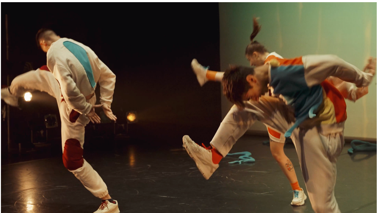
Figura 8. registo integral em vídeo. Dança, onde estás? [captura de ecrã]

Neste solo foi importante sobretudo trabalhar nas camadas emocionais e psicológicas, trazendo a complexidade da dramaturgia que deveria habitar este corpo, para uma melhor integração da estória que se pretendia contar e é nesta cena que surge o climáx . Após esta cena e em consequência da descoberta da dança, por parte da girafa, surgiu a cena da festa final, onde todos os intérpretes dançam a segunda frase coreográfica em uníssono, mas tendo em atenção as particularidades de movimento de cada animal que estivessem a interpretar — conforme figura 8. O resultado é uma frase coreográfica que parece ser a mesma e é de facto, mas cujas diferenças e semelhanças se dão pela “familiaridade do gesto” (Barros, 2009), tão presente em toda a criação da peça. Surge nesta cena, por fim, a resolução . Por ser uma peça criada e direcionada ao público juvenil, considerou-se importante sublinhar a moral da estória: “todos conseguimos dançar, desde que encontremos a nossa música” (Andreae & Parker-Rees, 2018). A cena da festa final vem, assim, consolidar a dramaturgia da peça. É uma festa onde impera a alegria e onde se convoca o público a participar na dança.