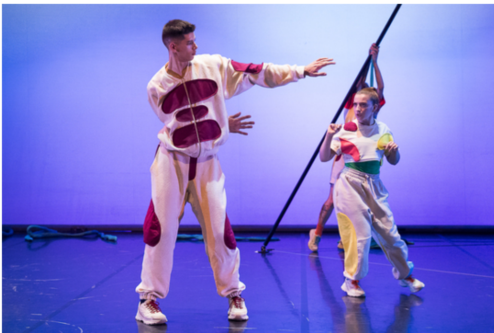
Figura 5. Dança, onde estás? [fotografia digital]

Conforme mencionado na contextualização da obra literária, há um momento em que a girafa descobre o seu corpo e a sua dança. Nesse sentido, foi criado um solo para o intérprete que incorpora a girafa, que partisse da redefinição da segunda frase coreográfica, remetendo sempre à “familiaridade do gesto” (Barros, 2009). A ideia era que à medida que o intérprete repetisse a frase coreográfica, a mesma se tornasse mais coesa e inata no seu corpo e, por isso, na interpretação da girafa se sentisse uma maior confiança na execução desta frase coreográfica. Nesta cena, os restantes intérpretes adotavam uma postura de espectadores dentro da própria peça, ainda que intervindo através do uso da palavra falada, como se pode ver nas figuras 5 e 6.