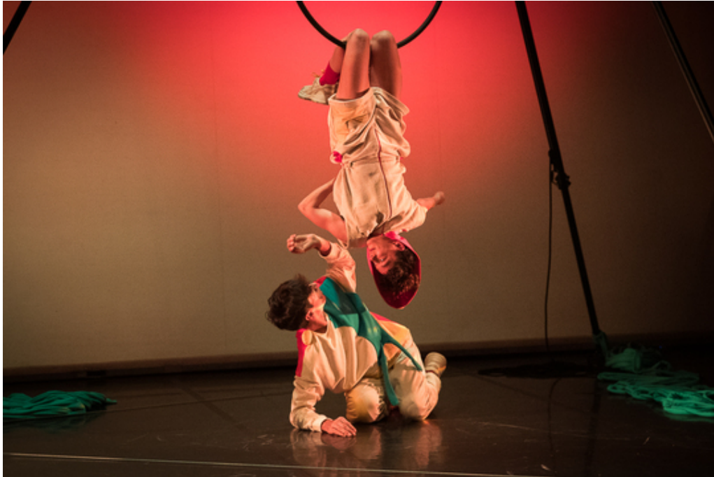
Figura 2. Dança, onde estás? [fotografia digital]

uma reflexão sobre o papel do intérprete na obra “Dança, onde estás?” de Né Barros e Jorge Gonçalves