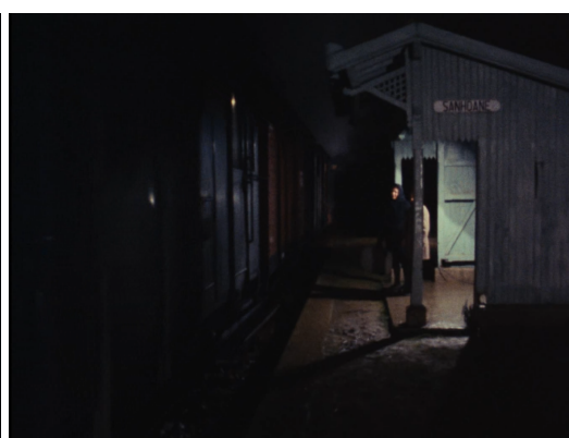
2º plano do comboio e sua partida (1h46s)

No 1.º plano do comboio do filme (08m34s - 09m42s = 1m12s) a duração é usada como ponto de tensão, é um plano escuro, com pouca luz, como o eram, ainda são algumas, as estradas para chegar a estes lugares em Trás-os-Montes. E o comboio ganha através do tempo que é concedido ao plano, para além da sua referência imediata e directa de ligação entre regiões, uma noção simbólica de veículo de união, desse tempo passado rupestre que está na terra, com o presente, a modernidade, que volta a ligar os territórios geográficos através das máquinas. Se a criança espera pelo familiar na gare, pelo encontro, também o espectador aguarda pelo que se seguirá. Uma sensação de espera que promete, de novo, um trajeto no tempo histórico, marcado pela passagem visual pelas pinturas pré-históricas, que se concretizará no movimento das crianças, nos seus caminhos, nos seus desvios e deambulações.