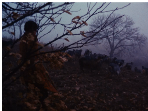
(último plano do filme)

A temporalidade não é cronológica, ela é luzidia, segue a luz de cada plano, encontra aí as suas elipses, jogando com uma lógica de disseminação de unidades narrativas, uma ramificação que faz lembrar uma árvore, a ramagem como as raízes. O que permite ao espectador saltar no tempo histórico, mitológico, lendário, à mais profunda atualidade, simultaneamente. E também, no sentido antropológico, capturar o conjunto dos fenômenos sociais, culturais, etc. que ocorrem e se desenvolvem através do tempo histórico. A forma como Reis e Cordeiro tratam o tempo em Trás-os-Montes parece ser algo aproximado a uma tentativa de ligação entre o(s) passado(s) longínquos e o(s) presente(s), como se o tempo fosse simultâneo e por isso dobrado, como se o passado fosse acessível numa ordem mágica, em que o adulto já não se inscreve mas as crianças sim. Tal é feito na planificação do filme e na montagem. É claro que para se ter chegado a isso foi porque o propósito era filmar.