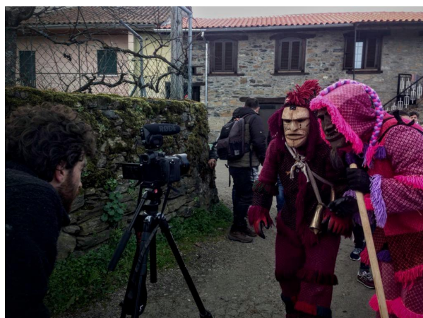
Tentativa de encontrar o plano do Entrudo, feita em colaboração com os Máscaros de Vila Boa de Ousilhão.

O que se tentava fazer não era propriamente uma suspensão do tempo mas a sobreposição de camadas narrativas das questões, já mencionadas. Que em si poderiam compor um espaço aporético e poético narrativo, onde os Máscaros e o rito encarnam o ânimo local comunitário e a sua identidade resistente ao longo do tempo, para dentro da contemporaneidade. E são no filme a razão de fundo para a viagem, o pretexto 41 . Concluindo, Vila Boa de Ousilhão foi o lugar que encontrei para registar a presença do Entrudo e dar através da imagem a noção de máscara/realidade, individual e colectiva. Foi ali que senti um equilíbrio entre o que ainda é possível enquanto ponte frágil entre passado, presente e o futuro e o quis registar de alguma forma “realista”. 42