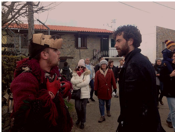
A combinar o plano com o jovem Máscaro

Entrudo uma aparência de festival onde o anonimato impera, os Máscaros e as Marafonas fazem questão de tocar em toda a gente e ao fim do dia toda a gente se conhece. Vão em desfile pela aldeia, parando em pontos específicos para dançar , comer, beber e conviver e discursar .