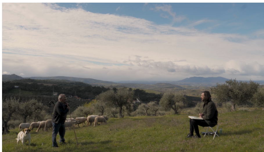
Still do último plano de Céu Aberto (10:25 - 12:55)

Creio, que ao contrário da cena do jantar consegui alcançar a concisão da palavra que unifica todo o filme: “o que estais a fazer aqui”, pergunta ao pintor que responde, “estou a pintar a paisagem”, “é bonita, mas querem destruí-la com minas a céu aberto”, “não podemos deixar que isso aconteça”, diz o pintor, ao que responde o pastor, “são os políticos que temos, fazem as leis à vontade deles”, “olhe, quer a pintura? Dê-me só tempo para a acabar!”, “pode ser, o tempo é o que não me falta ”.