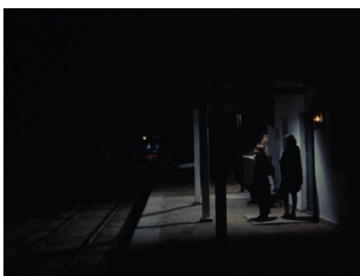
1.º plano do comboio e sua chegada (08m34s)

Logo depois vem a cena da história do cancionista, da branca-flor , que vai desde o plano exterior da casa rústica de pedra ao interior da mesma, os diversos planos fixos, que atentam demoradamente nos olhares das crianças, que serão o fio condutor do filme. Os seus protagonistas, poderíamos dizer, que induzem o espectador na forma de estar e ser da infância, talvez, em que a imaginação seja ainda capaz de manipular as leis da física e seja possível manobrar o tempo histórico, como se fosse possível viajar no tempo. Assim, também o espectador ouve a história da Branca Flor e lembra-se do cavalo do pensamento , essa história que vive no inconsciente colectivo. Os close-ups e os planos-médio podem não ser longos mas respiram tempo, logo à partida. O ambiente familiar é apresentado e logo chegamos a um plano fixo e longo que é o plano da chegada do comboio que tem 1 minuto e 12 segundos, o que já é um plano longo.