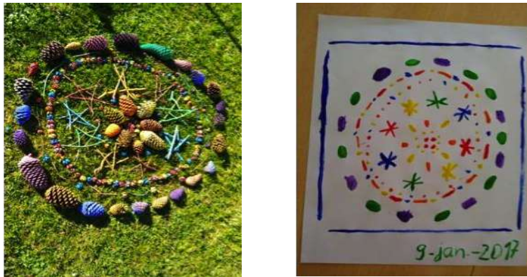
Figura 2. Fotografias da composição 3D e da sua representação 2D.

Na experiência A , foram realizadas composições com simetria a partir de elementos naturais ( Land Art ). Destaca-se a intenção de obter uma representação 2D de um objeto 3D em que cada elemento da composição tem uma representação específica que foi discutida com as crianças. A natureza coletiva da composição elaborada permitiu desenvolver um diálogo participado com as crianças. Na composição 3D está presente a estruturação espacial, no diálogo de fruição e de realização da passagem para a representação 2D está presente a estruturação geométrica (Figura 2).