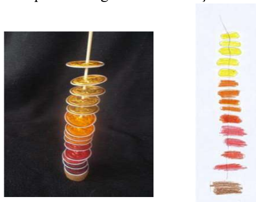
Figura 4. Fotografia de uma composição 3D e da sua representação 2D.

Na experiência D , houve intenção de estabelecer relações de paralelismo entre elementos de uma composição, com o objetivo claro de trabalhar o conceito de paralelismo no plano (retas paralelas) e no espaço (planos paralelos), (Figura 4). Estes conceitos foram trabalhados em simultâneo com a exploração artística e visual. As atividades de estruturação espacial foram trabalhadas com intencionalidade de estruturação geométrica em que o diálogo com as crianças teve um papel importante.