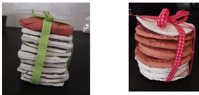
Figura 3. Fotografias do prisma e do cilindro construídos em fatias.

Na experiência C , a estruturação espacial do paralelepípedo foi trabalhada de dois modos diferentes. Primeiro, o paralelepípedo foi visto e trabalhado pelas crianças como poliedro constituído por três pares de faces paralelas e foi estabelecida uma relação explícita entre este sólido e sua planificação. Depois, o paralelepípedo foi estruturado a partir da repetição e justaposição de vários planos iguais (Figura 3). Nesta fase de estruturação esteve presente a iniciação à estruturação lógica formal na medida em que o paralelepípedo foi visto como um prisma quadrangular e foi associado ao cilindro. Os dois sólidos foram construídos em fatias, como mostram as fotografias.