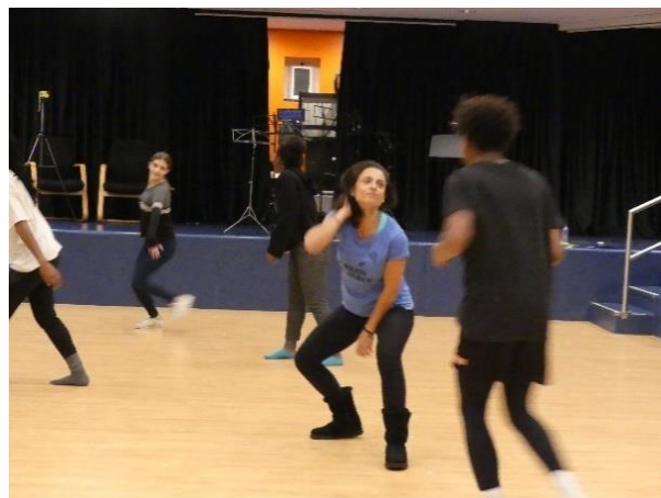
(figura 9 e 10 ensaios)