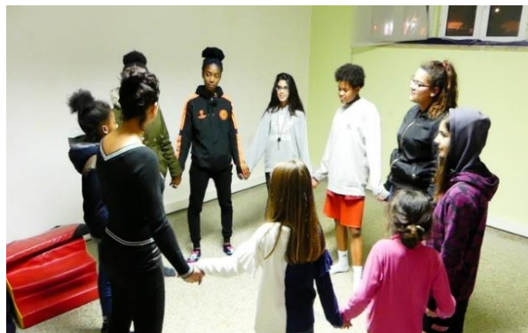
(figura 11 e 12 ensaios)