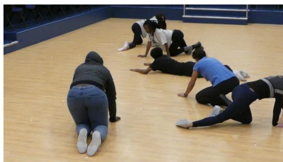
(figura 17 e 18 ensaios)

As participantes assimilam as indicações. São dados tempos longos de exploração. Vão sendo anunciados os níveis de 1 a 10. No nível 5 o ator está entre o animal selvagem e a personagem que vai criar a partir deste animal. Vai abandonando gestos, vai fazendo escolhas do que vai ficar para esta personagem: o olhar, algum tique, ritmos, vai personalizando até ao resultado final.