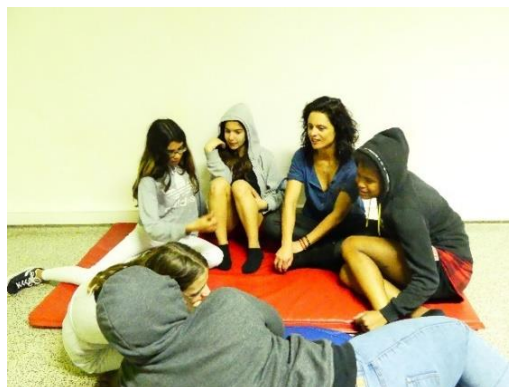
(figura 15 e 16 ensaios)