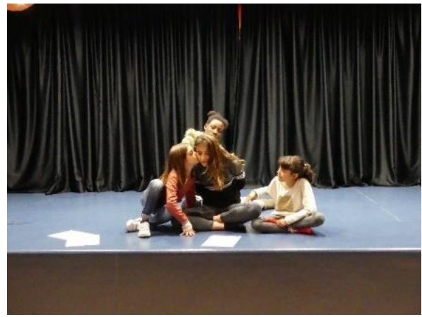
(figura 19 e 20 ensaios)