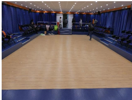
(figura 5 e 6 ensaios)