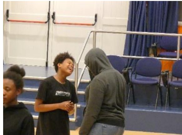
(figura 13 e 14 ensaios)