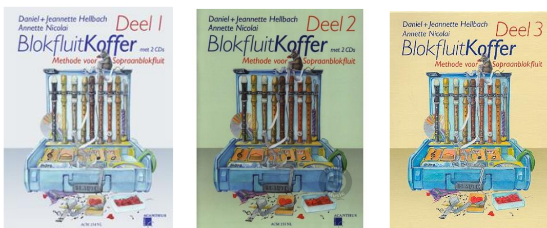
Figura 2: Capas dos livros Blokfluit Koffer 1, 2 e 3

HELLBACH, Daniel + Jeannette; NICOLAI, Annette (S.d.); Acanthus-Music