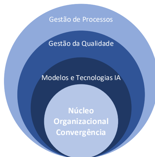
Figura 2.1 - Estrutura básica de Convergência da Revisão da Literatura.

Este capítulo apresenta o enquadramento teórico da dissertação, analisando a aplicação das tecnologias de Inteligência Artificial na gestão de processos e da qualidade no setor industrial. A revisão da literatura adota uma abordagem integrada, articulando os principais modelos e tecnologias de IA com os domínios operacionais e organizacionais da indústria como pode ser visto de uma forma mais estrutural na Figura 2.1 .