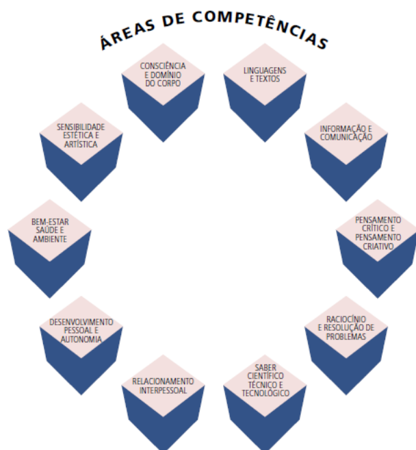
Figura 1. Áreas de Competências do “Perfil do Aluno” (2018).

Finalmente, este Perfil dos Alunos concretiza-se num conjunto de áreas de competências, entendidas nas suas três dimensões, tal como vem sendo definido nos documentos orientadores do currículo em Portugal desde 2001 (Direção de Educação Básica, 2001): conhecimentos, capacidades e atitudes (Figura 1).