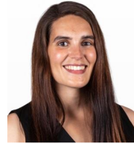
CAROLINA FERREIRA RESAPES NAPE-IST-UL