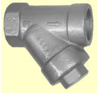
Extremidades Roscadas ou SW