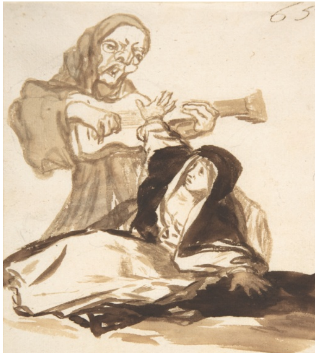
Imagem 5: Goya, A freira e o fantasma