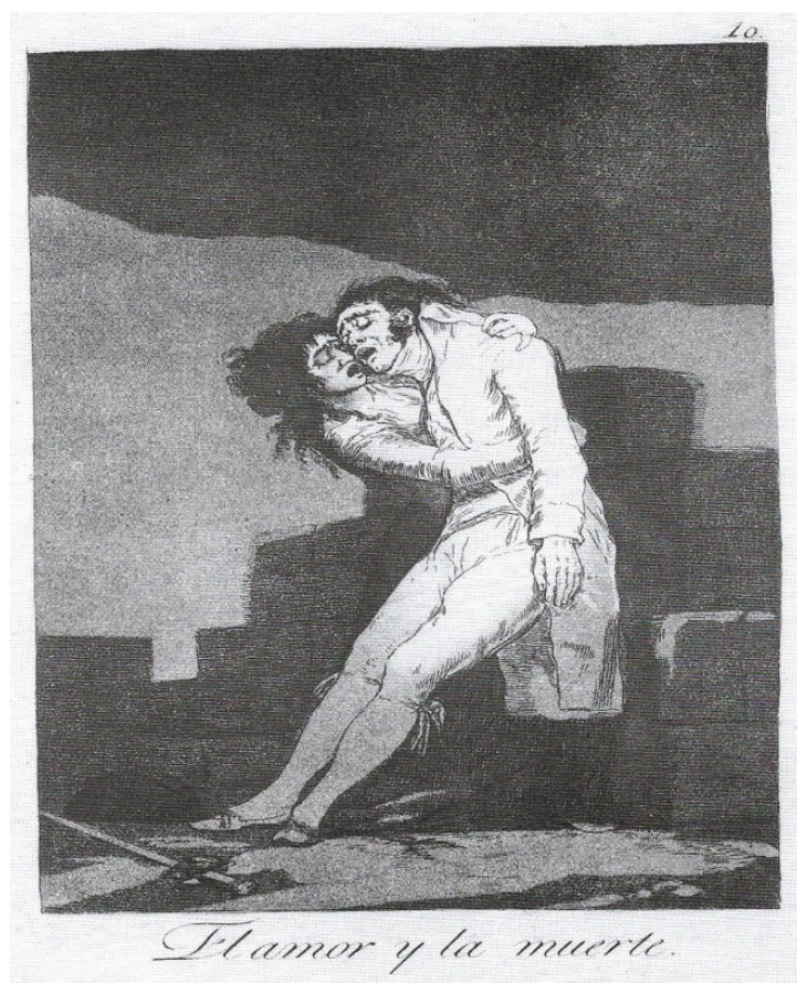
Imagem 4 – Goya, Capricho 10

A fonte de inspiração desta cena pode encontrar-se no capricho de Goya com o mesmo título. Nele vemos um majo mortalmente ferido, nos braços de uma maja, em cujo olhar é visível uma expressão de pânico.