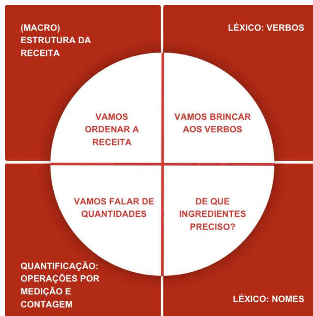
Figura 3. Representação das atividades propostas no protótipo funcional (Retirado de Cardoso e Rodrigues, 2018a)