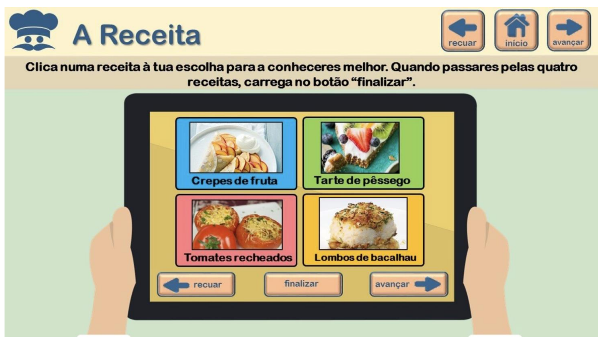
Figura 2. Captação de ecrã do protótipo A receita

Na sequência deste processo, o protótipo de recurso digital produzido pelo grupo de trabalho privilegia uma estrutura não linear, que permite que o utilizador determine o percurso a seguir para a realização das atividades. Organizando-se em torno de um ecrã principal com imagem e título de quatro receitas culinárias, o utilizador é convidado a escolher a receita por que quer começar (cf. Figura 2).