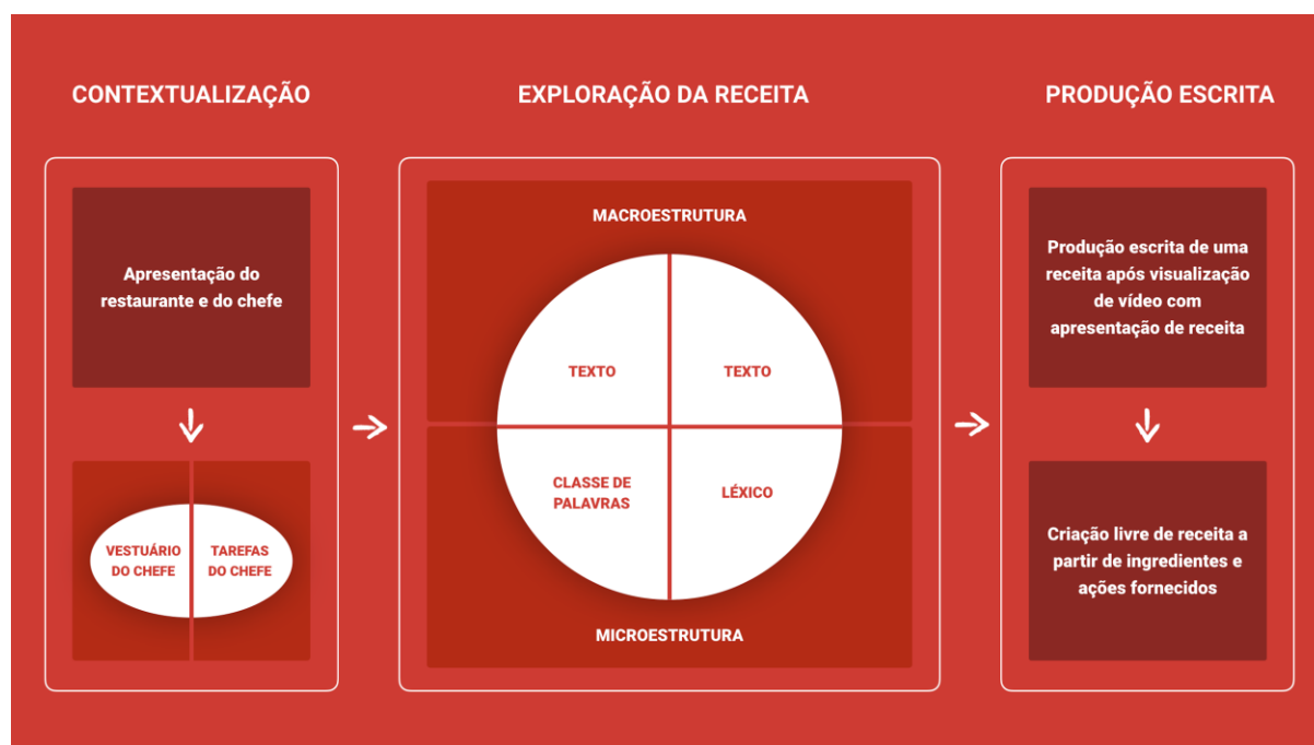
Figura 2. Representação esquemática das atividades propostas para o desenvolvimento do protótipo

No desenho e produção do recurso, exploraram-se características multimédia que combinam meios estáticos (textos e imagens) com meios dinâmicos (vídeo, áudio e animação). Numa primeira etapa, foram desenvolvidas as seguintes ações: (i) conceção da estrutura lógica de apresentação dos conteúdos; (ii) definição da disposição espacial e temporal da informação; (iii) desenho da interface gráfica do utilizador. Na etapa seguinte, foi desenvolvida a aplicação multimédia, que apresenta a interface gráfica do utilizador e que permite controlar a apresentação dos vários tipos de conteúdos, facilitar o acesso aos conteúdos e proporcionar uma melhor compreensão da informação minimizando a complexidade e a consequente desorientação do utilizador quando navega pelo espaço informativo (Ribeiro, 2012, pp. 15-16).