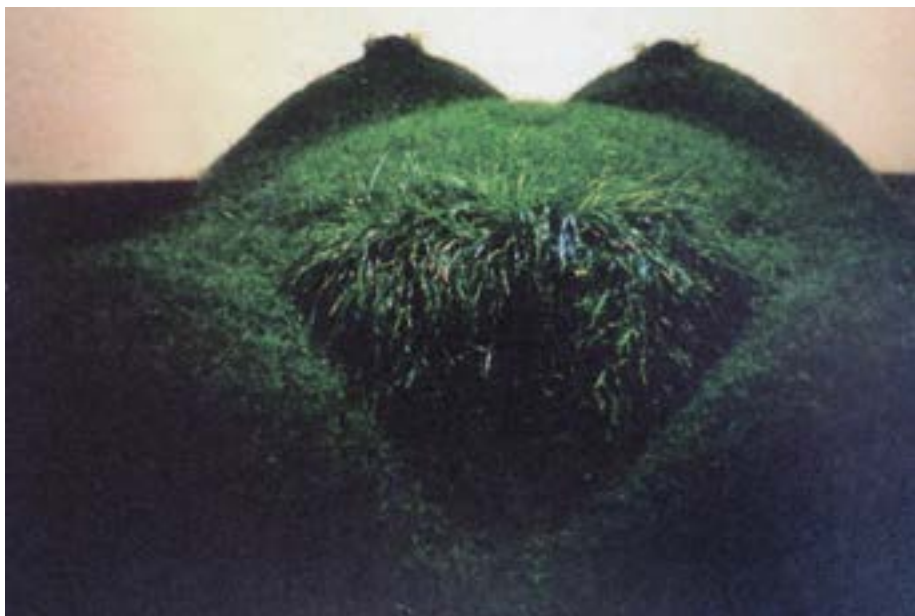
Figura 1: Mulher-Terra-Vida, madeira, acrílico, terra e Relva 90x180x300 cm, exposição Alternativa Zero, Galeria de Belém, Lisboa. (Adaptação de Leandro & Silva, 2016, p.201).

Partindo deste ponto e como a própria escultora afirmou 5 , a matriz de todo o seu trabalho relacionado directamente com as problemáticas da natureza e da cultura a partir de uma abordagem feminina é a Mulher-Terra-Vida , de 1977, realizada para a exposição Alternativa Zero , na Galeria de Belém, em Lisboa e também apresentada na Bienal de São Paulo com uma dimensão maior. A peça foi reproduzida na exposição Alternativa Zero , na Fundação de Serralves, no Porto, em 1997 (Figura 1). Existiram ainda outras propostas para o trabalho que não se chegaram a realizar. Este trabalho vai evocar a “Terra Mãe”, os valores femininos ancestrais, relativos aos mitos da fecundidade, nas deusas da maternidade, na “Mater” (Terra) fecundada enquanto símbolo maior da humanidade 6 .