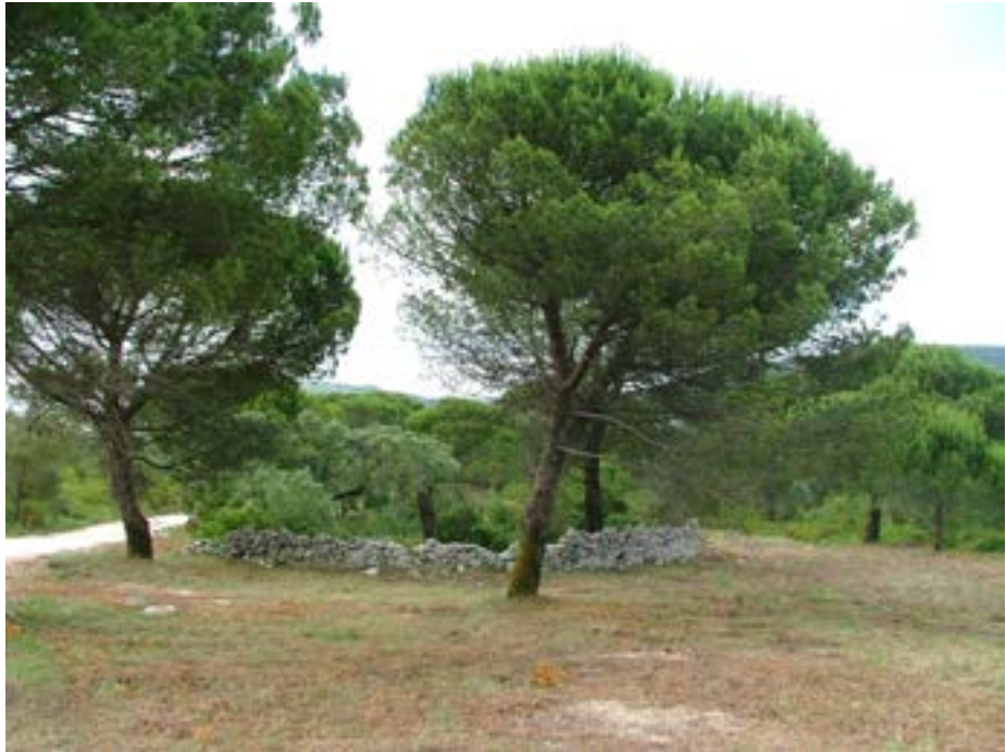
Figura 4: Muro tradicional da Serra de Aire e dos Candeeiros, Porto de Mós, Portugal.

Mais uma vez na edição em que participou como artista 12 , a primeira, em 1988, Clara marcou pela diferença. Sem deixar de trabalhar com a pedra, o material que justificava o concurso, construiu um muro em forma de espiral na Serra da Lua, que integra o Parque Natural da Serra de Aire e Candeeiros. Afrontando aquela que seria a lógica do evento, modelar uma peça desenvolvida na vertical para colocar sobre um plinto, concentrou-se antes na paisagem envolvente, interiorizando a ancestral forma de ordenamento daquele território, conseguido durante um longo e milenar processo de humanização. O relevo da Serra caracteriza-se maioritariamente por carsos 13 . Para que a agricultura aí tenha sido possível, obrigou à limpeza sistemática dos solos em que as pedras calcárias lhe eram retiradas e empilhadas a marcar o perímetro de cada parcela do terreno, construindo muros de resguardo ao vento, numa zona que se caracteriza agricolamente pelo minifúndio.