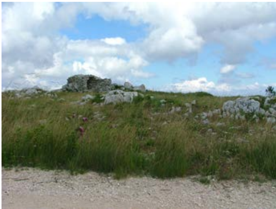
Figura 5: Abrigo de pastor e afloramentos cársicos da Serra de Aire e dos Candeeiros. Porto de Mós, Portugal.

A Grande Espiral reitera alguns princípios dos movimentos da Land Art que em Portugal não obtiveram grande ressonância à época. Para além da vontade da escultora, a matéria e o lugar determinaram a obra, já que esta depende da sua localização ao mesmo tempo que define uma nova paisagem.