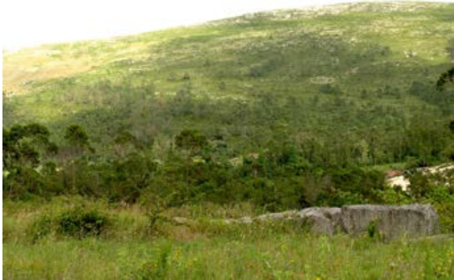
Figura 3: Clara Menéres, A Grande Espiral, Serra da Lua, Porto de Mós, Portugal. Pedra empilhada, 185m diâmetro. Vista norte. Créditos fotográficos Leonardo Charréu, 2018.

v.26 n.46 Jul/Dez 2021 e-ISSN: 2179-8001