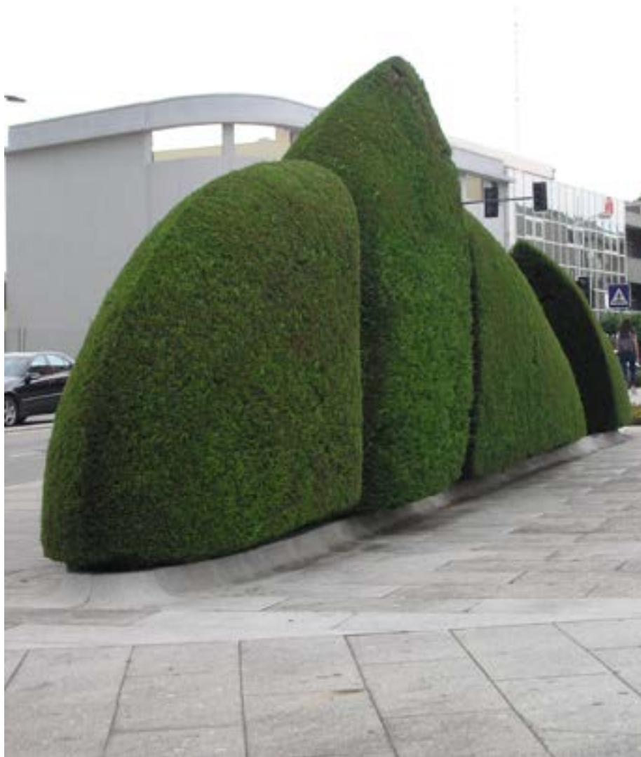
Figura 10: Escultura Topiária, Cupressos Leillandy , Clara Menéres, projecto de 2008, instalado em 2012. Santo Tirso, Portugal.

v.26 n.46 Jul/Dez 2021 e-ISSN: 2179-8001