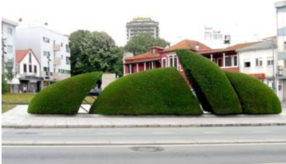
Figura 8: Escultura Topiária , Cupressos Leillandy, Clara Menéres, projecto de 2008, instalado em 2012. Santo Tirso.

Este projeto antecipou formalmente o da Serra da Lua, mas os conceitos inerentes, embora com alguma similitude (a simplicidade formal e material, a ancestralidade das práticas agrícolas das comunidades locais, etc.) diferenciam-se pela escala e por outras estratégias visuais empregues. Na Serra da Lua, por exemplo, teremos que nos afastar uns quilómetros, para uma outra elevação paralela, para apreciarmos na realidade toda a amplitude da intervenção.