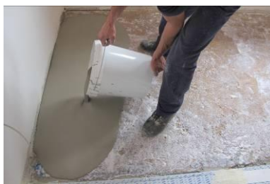
Aplicação do SecilPLAN 315