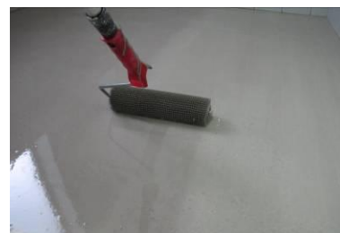
Uniformização da superfície c/ rolo de bicos