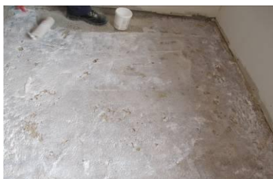
Aplicação do primário SecilTEK AD 21