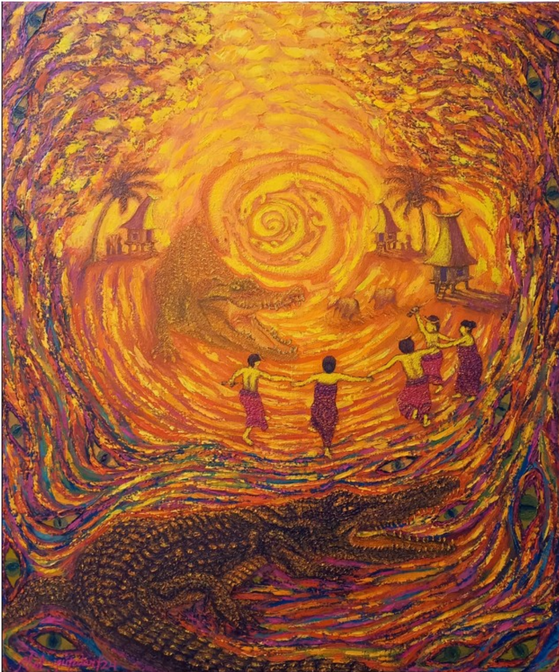
O meu Timor IX – 65x54cm - Óleo s tela 2024