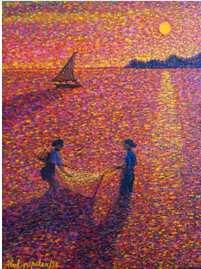
Apanhadoras de Mariscos na praia de Santana-Dili, 40x30 cm, óleo s tela 2023