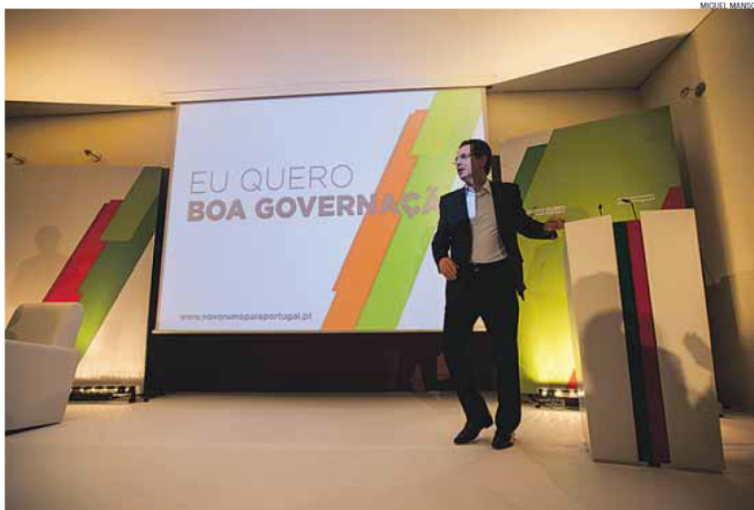
Seguro defendeu que o PS tem de assinar um “contrato de confiança” com os portugueses