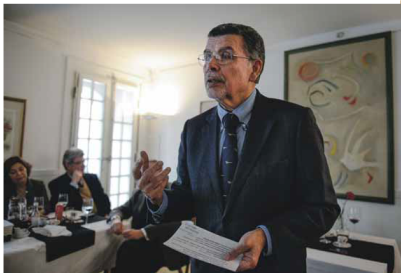
Capucho não poupou nas críticas ao PSD, num almoço onde Mário Soares fez questão de aparecer