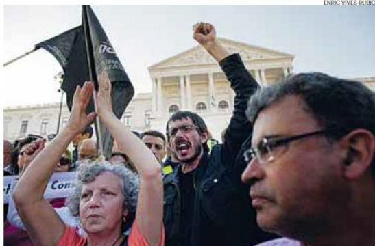
Cordão policial impediu trabalhadores de subir escadaria da AR