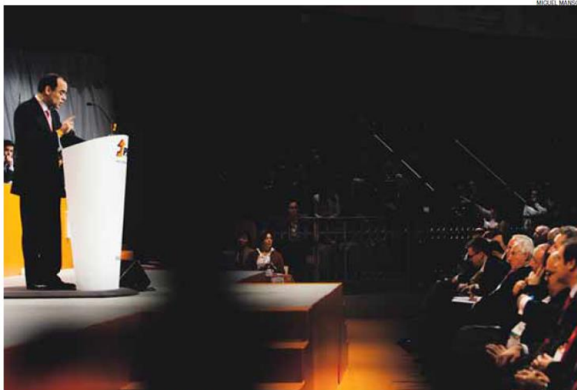
Morais Sarmento admite que o Presidente possa voltar a insistir num consenso após europeias

12 | PORTUGAL | PÚBLICO, QUA 26 FEV 2014