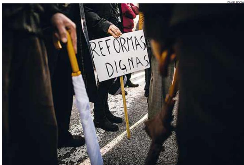
O alargamento da CES e o corte das pensões de viuvez não será cumulativo, garante a maioria

12 | PORTUGAL | PÚBLICO, QUI 30 JAN 2014