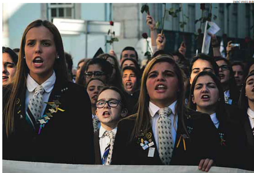
Milhares de militares desfilaram em protesto do Largo Camões até à Assembleia da República

O protesto iniciou-se no Largo Camões com a canção E Depois do Adeus , de Paulo de Carvalho, que foi a senha para o 25 de Abril, e encerrou com o hino nacional. Pelo meio cantou-se a Grândola .