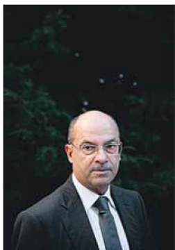
Ex-assessor presidencial acredita que TC chumbará a CES