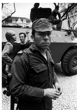
Vasco Lourenço quer Salgueiro Maia no Panteão Nacional

Segundo Vasco Lourenço, presidente da Associação 25 de Abril, Eduardo Lourenço é uma figura necessária à defesa dos ideais e valores democráticos da revolução.