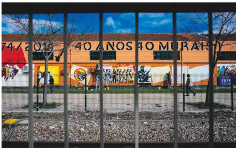
Em Alcântara, ao fundo da Avenida de Ceuta, o projecto salta à vista

o tenha feito, é uma obra de arte”, “é verdade, lembro-me bem, foi há 40 anos, o meu filho tinha um ano de vida”, diziam umas idosas que por ali deambulavam. Outros, grupos de jovens, comentavam: “Está