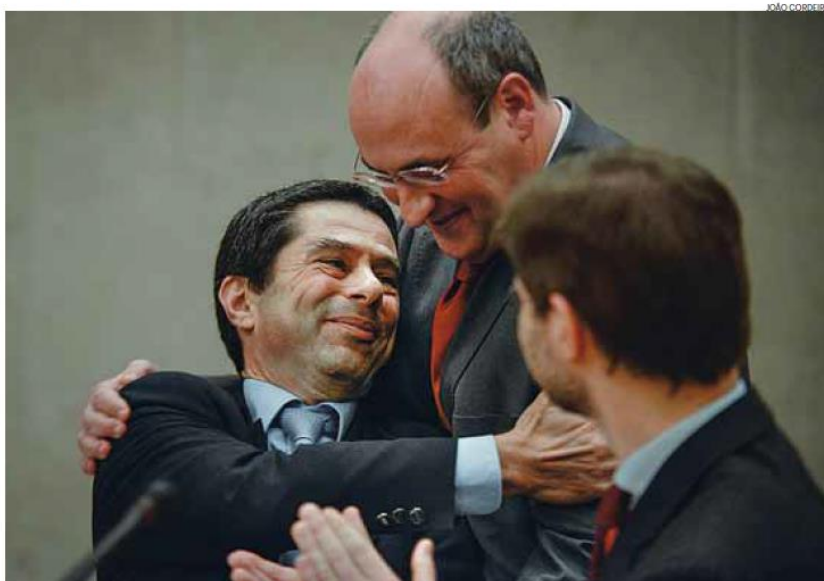
O ex-comissário europeu António Vitorino apresentou ontem o livro Vitor Gaspar por Maria João Avillez

perguntas da jornalista, bem como as subtilidades com que fala de todos as pessoas com quem trabalhou no tempo em que foi ministro, são como um “movimento lateral de cavalo”.