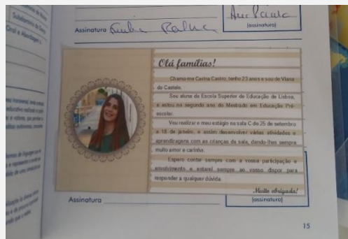
Figura 4. Cartão de apresentação enviado na caderneta.

Porém, depois de a educadora cooperante me ter alertado que várias famílias não costumavam ir à sala de atividade, decidi também enviar o mesmo cartão através da caderneta de cada uma das crianças, tal como é possível verificar na seguinte figura: