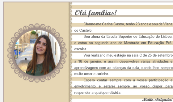
Figura 3. Cartão de apresentação às famílias.

foi feito o seguinte cartão de apresentação afixado no placar à entrada da sala de atividades: