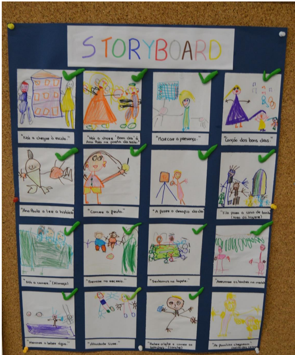
Figura 2. Storyboard do filme "Um dia no jardim de infância".