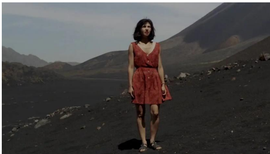
Figura 8 – Pedro Costa, Casa de Lava , 1994