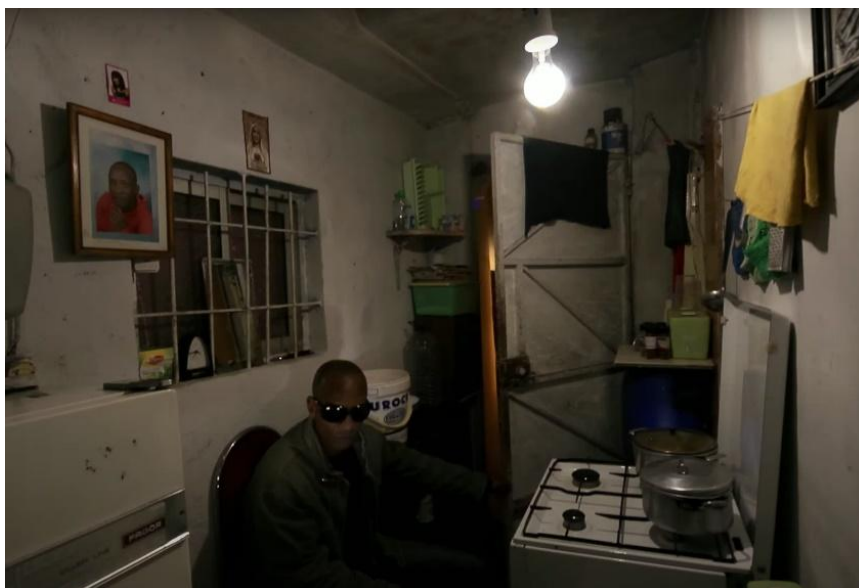
Figura 3 – Pedro Costa, Cavalo Dinheiro , 2014.

Assim, não se pode no presente concordar com a antítese proposta entre um teatro, ou neste caso um filme, ou uma filmografia “esteta”, por oposição irreconciliável com um teatro humano, neste caso uma cinematografia, humana, já que Pedro Costa prova com a sua obra que estes aspetos podem ser conciliados, sem que haja qualquer perda de parte a parte.