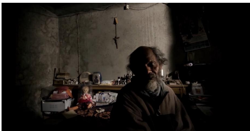
Figura 7 – Pedro Costa, Cavalo Dinheiro , 2014

Barthes cita ainda a consonância com o cenário: « Quanto mais a ligação entre o traje e o seu ambiente for orgânica, melhor se justifica o próprio traje. » 97 Aqui não há, também, qualquer dúvida. Seja em exteriores – Casa de Lava 98 , seja em interiores, como No Quarto da Vanda 99 , há uma coerência absoluta nos filmes de Pedro Costa e uma ligação extraordinária, mesmo quando isso pode significar o desconforto do ator na sua indumentária em confronto com o ambiente onde se sente deslocado e, a esse nível, a visita à Gulbenkian de Ventura é muito significativa. Reveja-se, de novo, mas agora sob este enfoque, a supramencionada sequência do filme Cavalo Dinheiro com música de “Os Tubarões” 100 , onde várias personagens são alvo de retratos filmados enquanto entoa a canção «Alto Cutelo», com as mais diversas características e os mais diferentes cenários, interiores, ou exteriores, e perceber-se-á a coerência entre o cenário e os trajes (figura 7), podendo ser incluída nesta mesma coerência filmica até a própria banda sonora, algo que o autor de «As doenças do traje de cena» não fala, mas que, no caso em apreço, não seria de todo despiciendo.