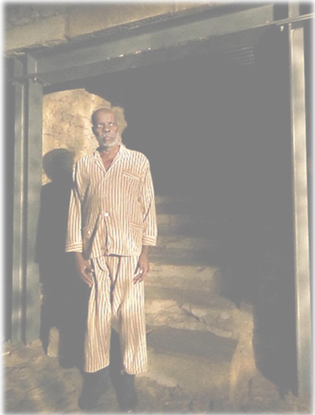
Cavalo Dinheiro Pedro Costa 2014