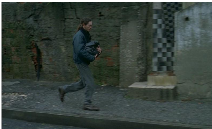
Figura 4 – Pedro Costa, Ossos , 1997.

Há a certeza que os trajés envergados pelo jovem pai, interpretado por Nuno Vaz, na longa-metragem Ossos 79 , são, em si, um argumento e que não se resumem a meros clichés, antes pelo contrário, contribuem para solidificar a dramaturgia da obra (figura 4).