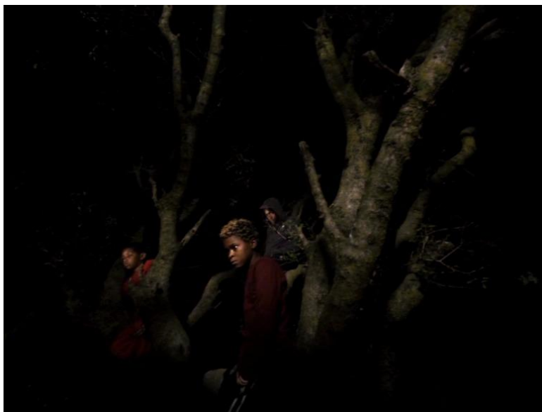
Figura 1 - Pedro Costa, Cavalo Dinheiro , 2014.

Raramente Pedro Costa recua no tempo, sendo uma exceção a referência à época do Processo Revolucionário em Curso, na sequência da Revolução de abril de 1974, no filme Cavalo Dinheiro 52 , onde se evidencia alguma preocupação para não cair em erros históricos, mas jamais cai na tentação do “infinitamente pequeno”, da mesma forma que esta “transcrição” do passado, jamais obnubila o gestus do filme. Está e estará sempre mais perto do intemporal Caravaggio de Dereck Jarman 53 do que de qualquer obra de Luchino Visconti, como o prova o supramencionado filme, com trajes intemporais, ou mesmo não se preocupando sequer em cair em anacronismos, a título de exemplo veja-se o caso do aparecimento em certas cenas de personagens envergando hoodis 54 que não eram ainda utilizados pela comunidade retratada no período a que o filme reportava (figura 1).