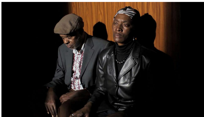
Figura 5 – Pedro Costa, Cavalo Dinheiro , 2014.