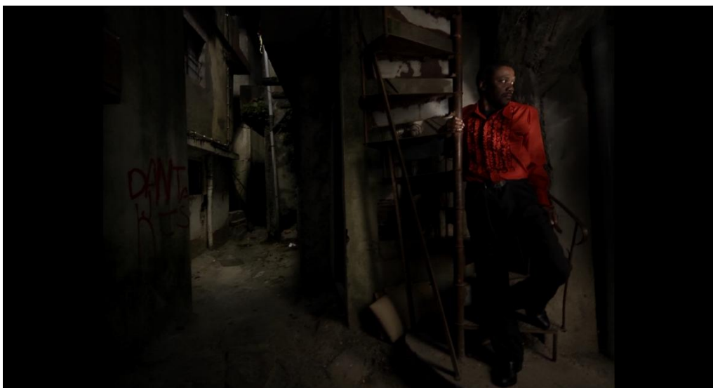
Figura 2 - Pedro Costa, Cavalo Dinheiro , 2014.