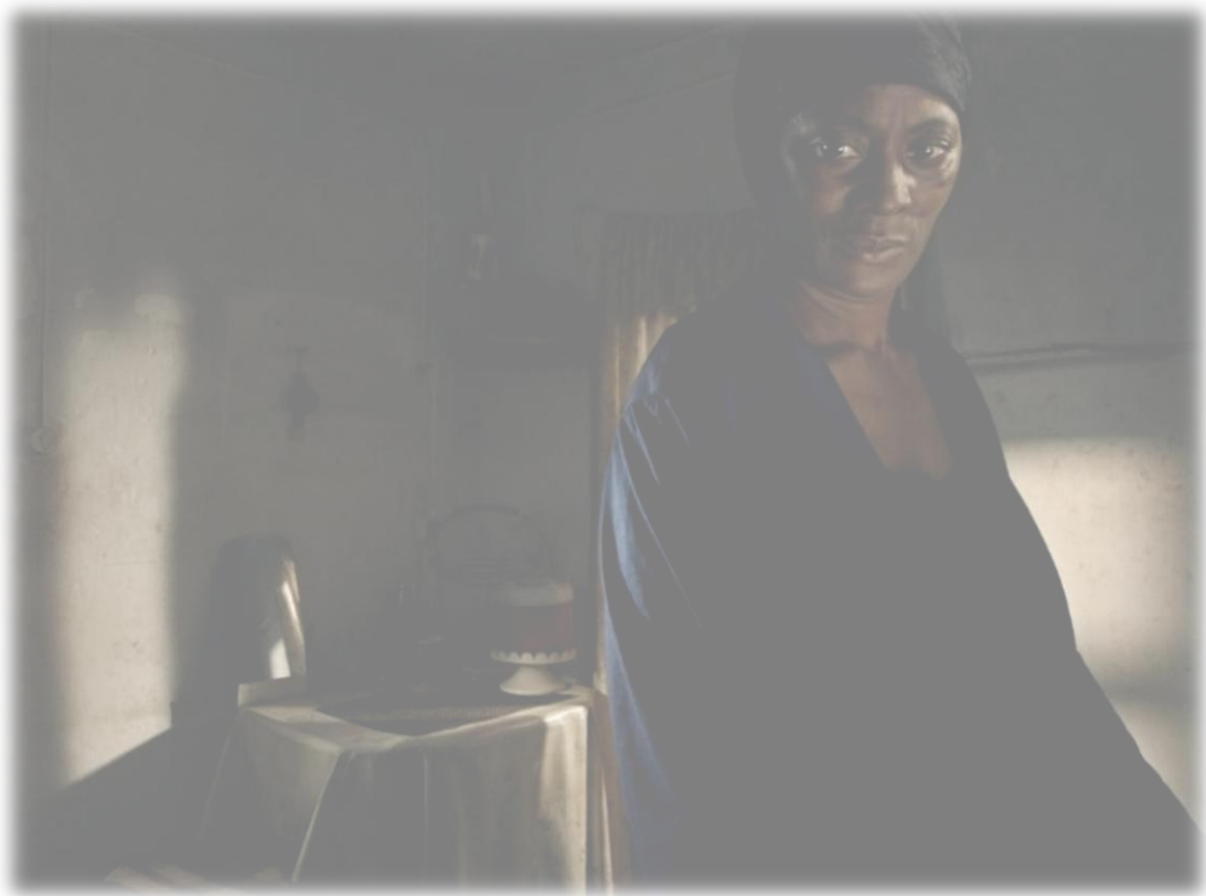
Vitalina Varela Pedro Costa 2019