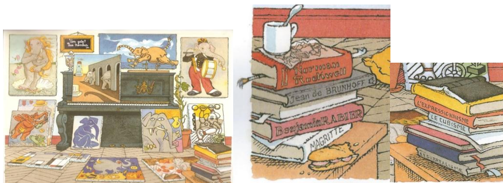
Figuras 7, 8 e 9: Bachelet, M. (texto e ilustração) (2009). O meu gato é o mais tolo do mundo . Lisboa: Caminho.

Em O meu gato é o mais tolo do mundo (2009) de Michel Bachelet (texto e ilustração), uma excêntrica personagem julga ser dona de um gato, que afinal é um elefante, e decide retratar o seu querido animal de estimação inspirando-se em quadros de pintores célebres, substituindo a personagem original pela figura “do seu querido gato”. Observando essas imagens, é possível descobrir marcas de Cézanne, Manet, Miró, Picasso, Magritte, Mondrian, Chagal, Matisse, entre outros, (cf. Figura 7). Nas ilustrações deste álbum, aparecem também imagens de livros em cujas lombadas é possível ler títulos como expressionismo, surrealismo, nomes como Rabier, famoso criador da la vache qui rit , e Brunhof, o criador de Babar, o elefante que encantou gerações (cf. Figuras 8 e 9).