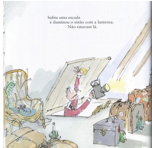
Figura 5: Blake, Q. (texto e ilustração) (2009). Catatuas . Lisboa: Caminho.