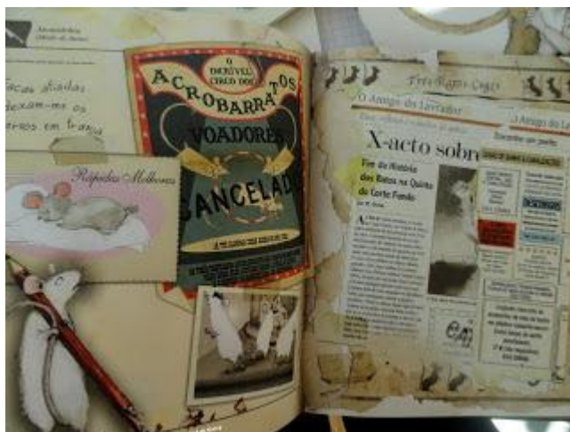
Figura 6: Gravett, E. (texto e ilustração) (2010). O Grande Livro dos Medos do pequeno rato . Lisboa: Livros Horizonte.

Consultado online em 15 de novembro de 2013 (ver bibliografia).