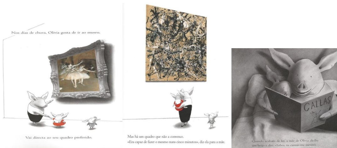
Figuras 10, 11 e 12: Falconer, I. (texto e ilustração) (2000). Olívia . Lisboa: Notícias Editora.

No álbum Olívia (2000) de Ian Falconer (texto e ilustração), conhecemos uma porquinha muito simpática e irrequieta que, nas suas visitas a museus, admira um quadro de Degas e outro de Pollock (cf. Figura 10 e 11). Esta porquinha adormece, ouvindo histórias que a mãe lhe lê e sonha vir a ser uma grande cantora lírica à semelhança de Maria Callas (cf. Figura 12), cuja biografia ouviu ler. Em ambos os álbuns, estas referências estão disseminadas na ilustração, oferecendo-se como pistas que podem conduzir a percursos de descoberta de diferentes manifestações artísticas.