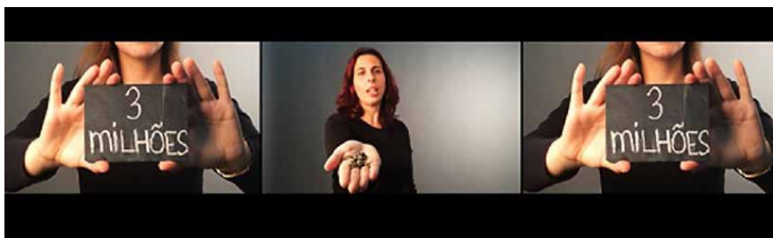
Figura 7 · Instalação — Apresentação final de projetos.