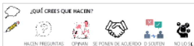
IMAGEN 2. Pregunta cuestionario de Ciclo Inicial (ejemplo I)

La dificultad que comporta este tipo de actividades en educación primaria, en especial en ciclo inicial, ha sido abordada a partir del uso de imágenes para las opciones múltiples a elegir en las respuestas. Veamos un ejemplo en la siguiente imagen: