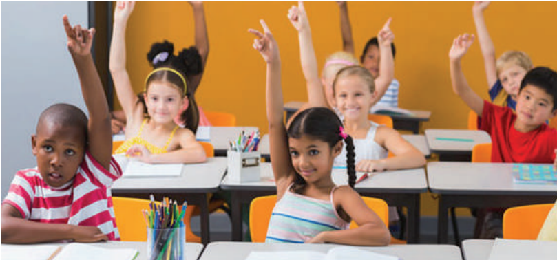
IMAGEN 1. Participación democrática

En nuestro proceso de indagación hemos diseñado un dossier de actividades que el alumnado debe realizar. El dossier presenta pequeñas variaciones para ser contestado al final de cada ciclo de primaria, ciclo inicial, medio y superior. Las actividades inciden en los conceptos de pluralismo, desacuerdo y conflicto en democracia. La primera actividad parte de la imagen de una clase donde niños y niñas mantienen la mano alzada, en una situación que puede recordar una actividad de pregunta-respuesta o un debate en clase. A partir de esta imagen se plantean preguntas en relación a la participación, el acuerdo o el desacuerdo.