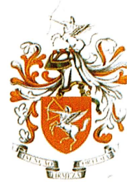
Fig. 20 – Brasão de Armas da Brigada de Trânsito de 1985

Por fim a Brigada de Trânsito com o campo sem modificações, mas tendo em timbre um «sagitário alado saínte de prata» e a divisa « ISENÇÃO-FIRMEZA-CORTESIA » (Fig. 20).