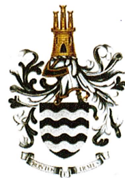
Fig. 14 – Brasão de Armas do Batalhão n.º 2 de 1984

Do Batalhão n.º 2 completamente reformulado, com escudo de negro, três faixas onçadas e prata, por timbre um castelo de ouro aberto e fenestrado de negro e a divisa « PRONTOS E FIRMES » (Fig. 14);