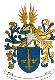
Fig. 12 – Brasão de Armas do Centro de Instrução de 1984

Paralelamente verificava-se uma correcção da descrição.