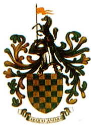
Fig. 16 – Brasão de Armas do Regimento de Cavalaria de 1984

O Regimento de Cavalaria com escudo xadrezado de seis peças em faixa e sete peças em pala de ouro e de verde, por timbre «um cavalo sainte, brincão e empinado, de negro tendo entre os membros anteriores uma bandeirola de oiro hasteada de vermelho» e a divisa « AEQUO ANIMO » (Fig. 16);