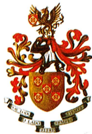
Fig. 18 – Brasão de Armas do Batalhão n.º 1 de 1984

O Batalhão n.º 1 , que passava a ter escudo de ouro, cinco escudetes de vermelho, cada escudete carregado de uma cruz de prata florenciada e vazia (a cruz da família Pereira), por timbre um grifo de ouro, animado e lampassado de vermelho segurando nas garras dianteiras um escudete do escudo, divisa « POR TODO O LADO, CÉLERES, SEMPRE FIRMES » (Fig. 18);