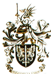
Fig. 19 – Brasão de Armas do Comando-Geral de 1985

O Comando-Geral com escudo de negro, uma espada antiga de prata posta em pala, acompanhada à dextra e à sinistra por dois dragões de prata, animados, lampassados e armados de vermelho, por timbre um dragão de prata animado, lampassado e armado de vermelho tendo na garra dextra uma espada antiga de prata, por divisa « DILIGENTIA E LABORE » (Fig. 19);