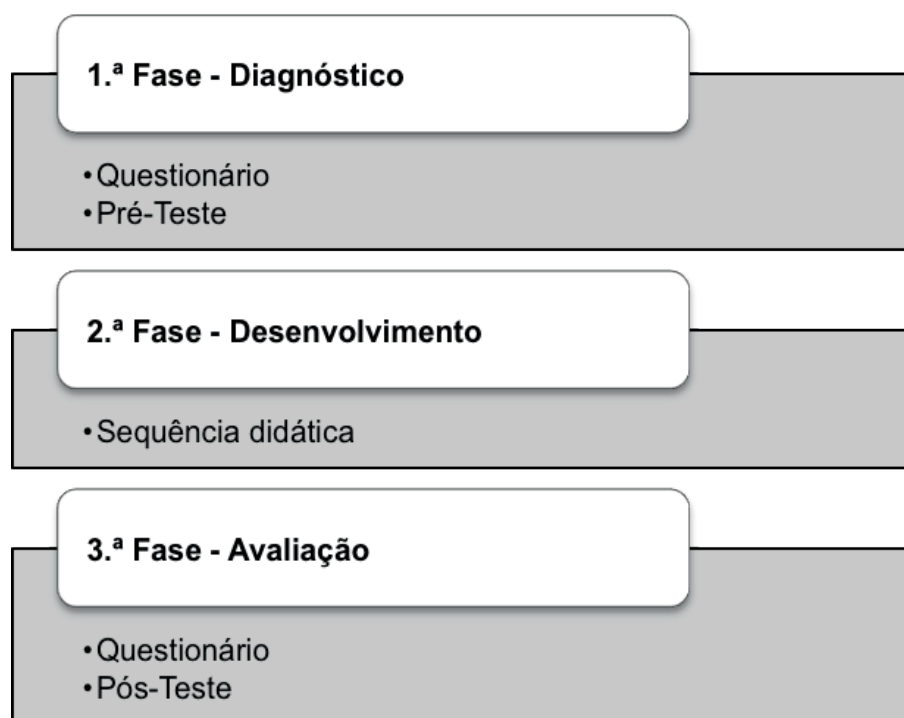
Figura 2. Fases do estudo. Planificação da Intervenção Educativa (dossiê de estágio) da autora.

Após a etapa de observação e de pesquisa documental, teve início a intervenção que se segmentou em três fases distintas, apresentadas em seguida (cf. Figura 2).