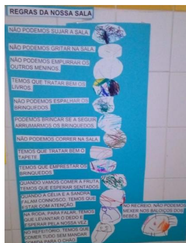
Figura 1. Regras da sala.

O quadro das regras representa “uma epistemologia no âmbito da construção do conhecimento social” (Oliveira-Formosinho & Andrade, 2011, p.25), servindo de suporte ao adulto e às crianças no decorrer na rotina. Com o passar do tempo, observou-se que as crianças se apropriaram das regras e que as respeitavam, talvez também pelo facto de terem sido elas as protagonistas da criação das mesmas, dando-lhes ainda mais valor, como se pode verificar no registo abaixo.