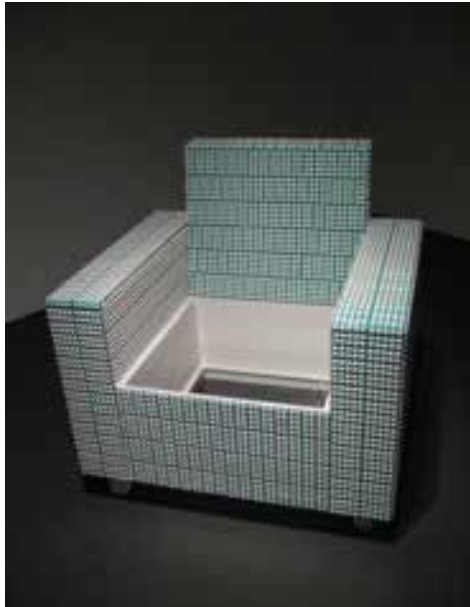
Figura 1 – Joana Vasconcelos, Sofá Aspirina (1997)

Blisters com comprimidos Aspirina de 500 mg, madeira, vidro (98 x 95,5 x 78,5 cm)