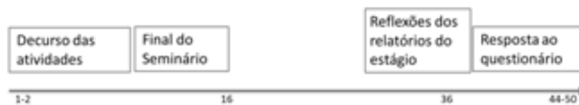
Figura 3 – Sequência, em semanas, dos diferentes momentos de realização das atividades e da recolha de dados.

grupo, oralmente, no final do Seminário e, posteriormente no final do semestre subsequente, com um questionário individual respondido através da plataforma de gestão da aprendizagem (moodle) usada no Seminário (Fig.3). Em todos estes instrumentos identificaram-se, categorizando-os, os modos como as atividades foram percebidas e valorizadas na perspetiva de formação em animação sociocultural.